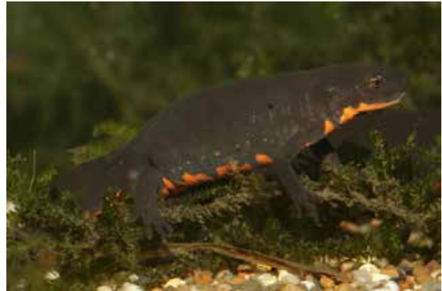
Soorten als de Chinese vuurbuiksalamander ( Cynops orientalis ) worden in grote aantallen wereldwijd verhandeld in de terrariumhandel.

Frank Pasmans: “Gezien het maatschappelijk belang van het behoud van Europese biodiversiteit, die door deze schimmel bedreigd wordt, is het zeer dringend dat overheden middelen vrijmaken om dit probleem snel en adequaat aan te pakken.”