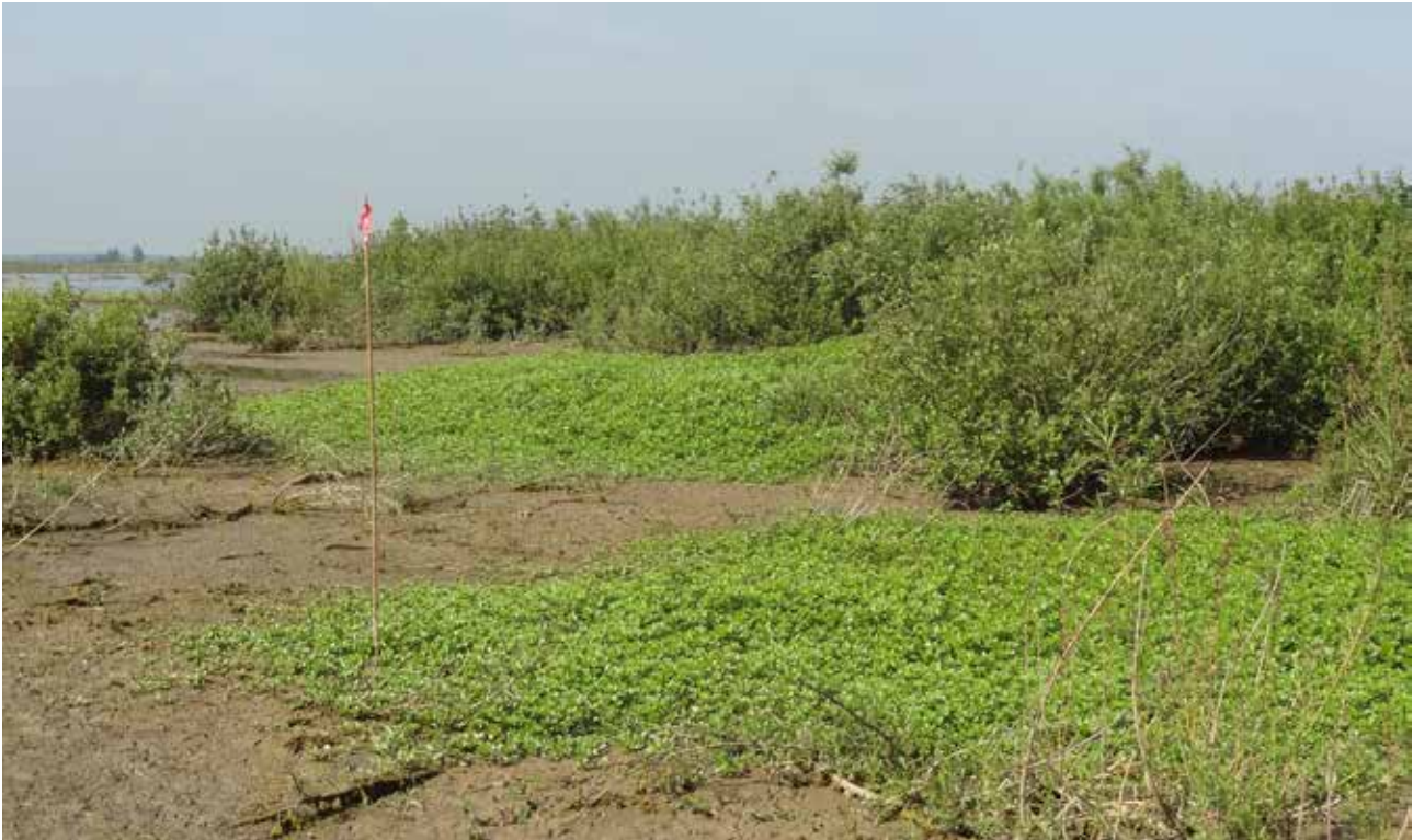
Oprukkend waterteunisbloem op droogvallende slikkige oever op Tiengemeten.

planten werden met behulp van een graafmachine tot op 30 cm diep uitgegraven en ter plekke in een diepe kuil gestort en vervolgens afgedekt met 1 meter grond. Bij controle in de volgende jaren bleek dat deze methode effectief was geweest en dat de planten hier definitief waren uitgeroeid. Het jaar daarop (2008) werd een kleine groeiplaats ontdekt langs een nieuw gegraven kreek in de Sophiapolder (Zeeuws-Vlaanderen). Deze kleine groeiplaats van nog geen vierkante meter is door de vinder, met toestemming van de beheerder (Het Zeeuws Landschap), eigenhandig met een schop afgegraven. De planten zijn hier later niet meer waargenomen.