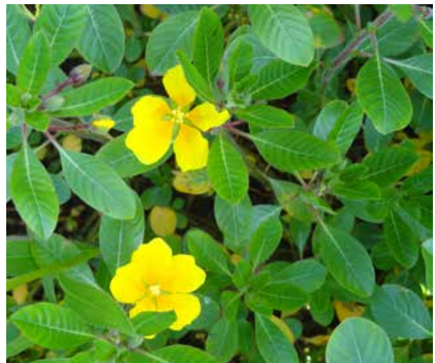
Kleine waterteunisbloem.

van de kleine waterteunisbloem was verwijderd. In 2006 werd in een stadsvijver in Lelystad een woekerende "waterteunisbloem" ontdekt. Nadat in 2008 de planten door de gemeente waren verwijderd bleek dat het ook hier kleine waterteunisbloem was geweest. Waren deze eerste vondsten, waarbij de soort aanvankelijk niet correct geïdentificeerd was, beperkt tot stadswateren, in 2007 werd de plant voor het eerst "onder zijn ware identiteit" ontdekt in een natuurgebied. In de recent heringerichte polder Kort- en Lang-Ambacht (Eiland van Dordrecht, Biesbosch) werd een groeiplaats van vele tientallen vierkante meters ontdekt. Na overleg met de NVWA is deze groeiplaats in november 2007 door Staatsbosbeheer verwijderd. De