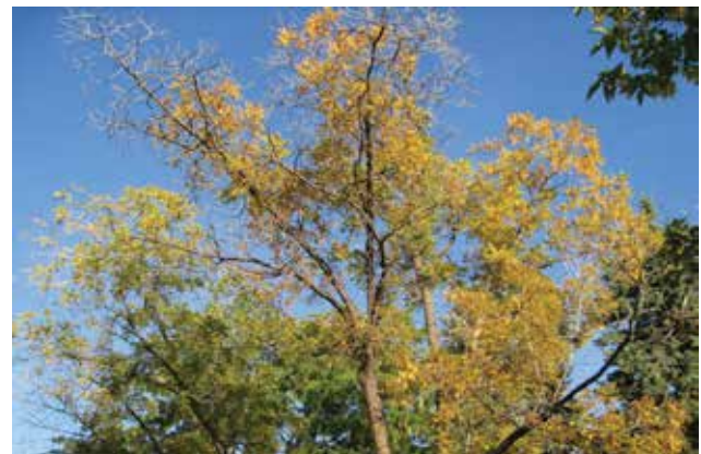
Aangetaste walnoot.

De Nederlandse Mycologische Vereniging is gevraagd op te letten op het voorkomen van deze tot op heden nog niet in Nederland aangetroffen ziekte. Verdachte bomen kunnen via exoten@mycologen.nl gemeld worden. Deze meldingen zullen worden doorgegeven aan het Team Invasieve Exoten.