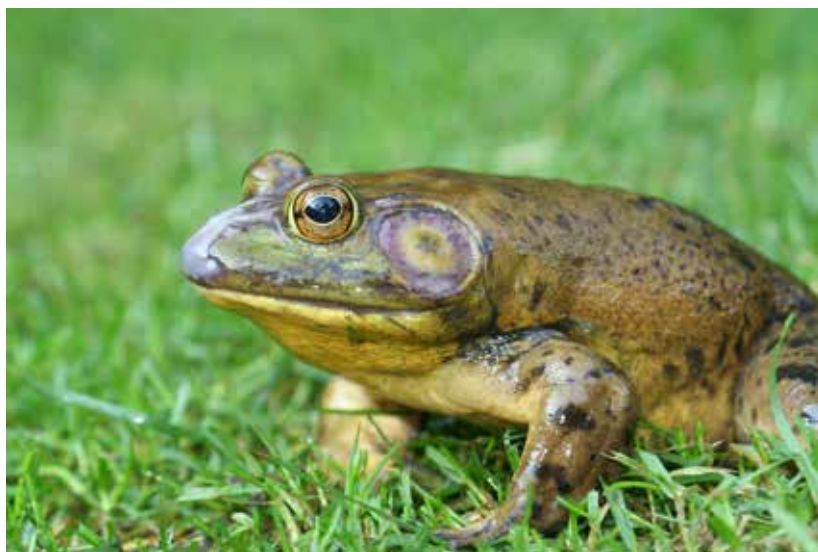
De in 2014 in Baarlo gevangen brulkikker.

De Amerikaanse brulkikker is op grond van meerdere kenmerken van de inheemse groene kikker te onderscheiden. Als hulpmiddel heeft RAVON een herkenningkaart gemaakt: www.ravon.nl > Soorten > Herkenning. We vragen u waarnemingen per ommegaande te melden, liefst vergezeld van een foto of geluidsopname (GSM).