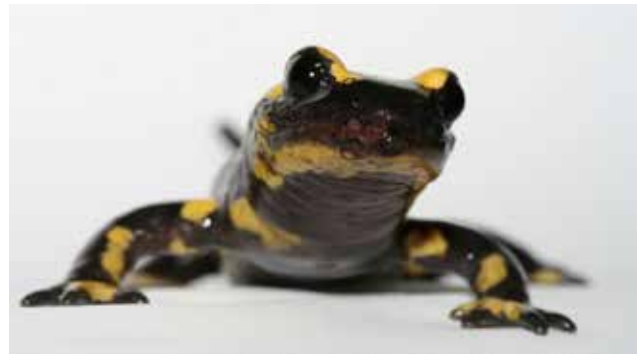
Vuursalamander ( Salamandra atra ) geïnfecteerd door de salamanderetende schimmel, de huid is ernstig aangetast.

An Martel: "Als een ziekte lange tijd aanwezig is in een gebied, ontwikkelen dieren resistentie. Globalisering heeft ertoe geleid dat mensen en dieren zich over de hele wereld verplaatsen, waardoor ziekteverwekkers in contact komen met gastheren die niet de kans hebben gehad om resistentie op te bouwen. Hierdoor kunnen ziekteverwekkers die in een nieuwe omgeving komen, zoals Bs, in erg korte tijd veel soorten met uitsterven bedreigen".