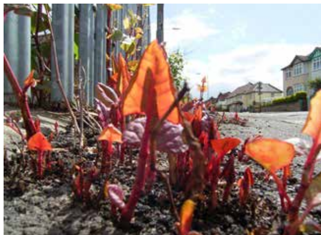
Japanse duizendknoop groeiend door asfalt.

Voor nadere informatie over de verspreiding van exoten, kaarten, foto's, samenvattingen en wetenschappelijke publicaties zie: http://www.cabi.org/isc Verdere informatie over het werk aan biologische bestrijding van Japanse duizendknoop in het Verenigd Koninkrijk kan gevonden worden op: http://www.cabi.org/japaneseknotweedalliance/ .