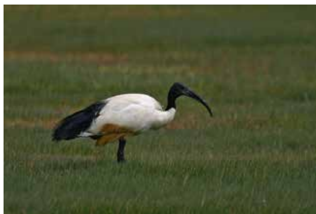
Heilige ibis.

De aantallen broedende heilige ibissen worden gevolgd binnen het Meetnet Broedvogels in het kader van het NEM gecoördineerd door Sovon Vogelonderzoek Nederland (zie www.sovon.nl ). Losse waarnemingen van niet broedende vogels kunnen worden doorgegeven via telmee.nl of waarneming.nl .