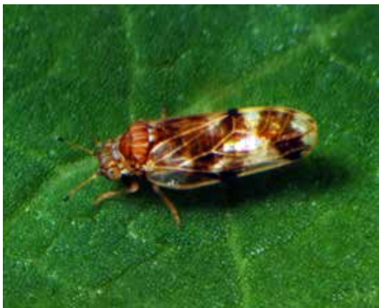
Volwassen Aphalara , lengte 2 mm.

Biologische bestrijding wordt al meer dan een eeuw toegepast om invasieve onkruiden aan te pakken in de landbouw en natuur. Wereldwijd zijn al meer dan 1300 biologische bestrijders ingezet om 400 invasieve onkruiden aan te pakken. In Noord-Amerika, Australië en Zuid-Afrika is de methode veelvuldig toegepast en blijkt het op de lange termijn vaak de enige effectieve en ecologische oplossing. Hoewel Europa tot nu toe de "donor" is van 152 biologische bestrijders van onkruiden elders, is het introduceren van biologische bestrijders in Europa nog steeds een nieuw concept.