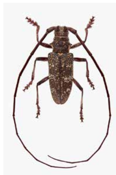
Sparrenboktor ( M. sutor ), noordelijke geelschildboktor ( M. urussovi ) en dennen-geelschildboktor ( M. galloprovincialis ).