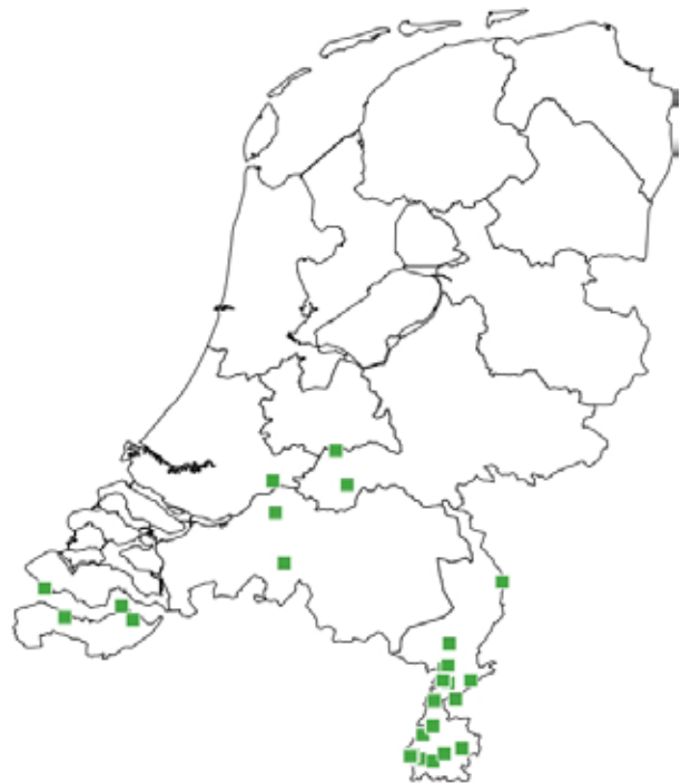
Verspreiding Kadeni-stofuil 2006-2014.

Of we reeds van populaties kunnen spreken, staat allerm minst vast. Het feit dat het merendeel van de waarnemingen uit september-oktober komt, wijst eerder op migratie. De nieuwe toestroom doet de mogelijkheid op een permanente vestiging hier wel toenemen.