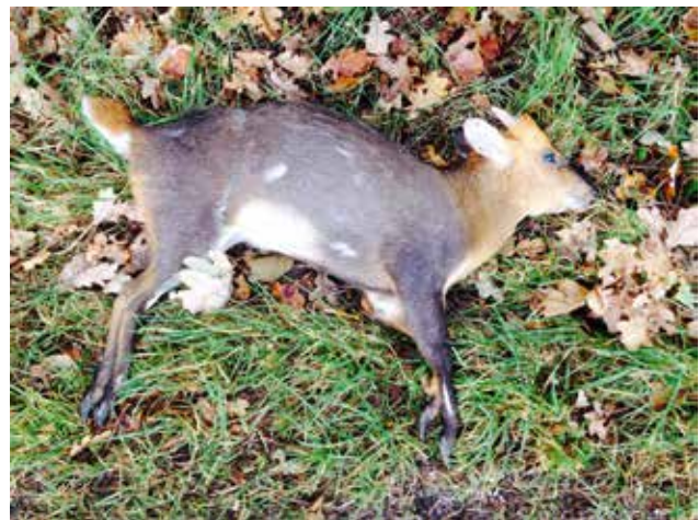
Verkeersslachtoffer muntjak Landgoed Baest.

Naar verwachting treedt op 1 januari 2015 de Positieflijst in werking, waarmee het houden van exotische zoogdieren voor een belangrijk deel wordt ingeperkt. De lijst is nog niet definitief; de muntjak zal er niet op komen vanwege het bezits- en handelsverbod. Het sikahert zal er naar verwachting wel opkomen, als te houden diersoort onder voorwaarden.