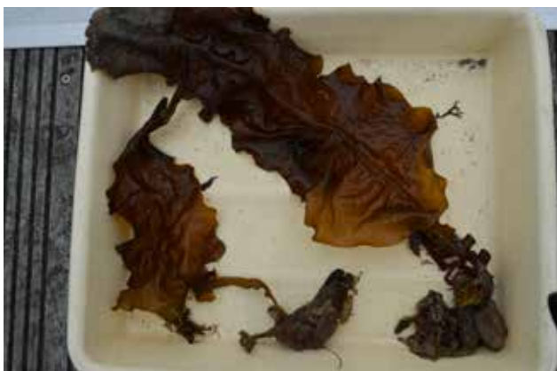
Jong exemplaar van wakame ( Undaria pinnatifida ), waargenomen in de haven van Burghsluis september 2014.

Wakame komt voor in rotsachtige kustzones, in het lage getijdengebied tot enkele meters onder de laagwaterlijn,