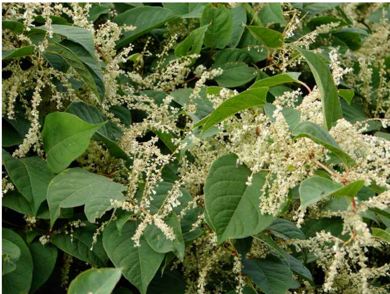
Japanse duizendknoop.