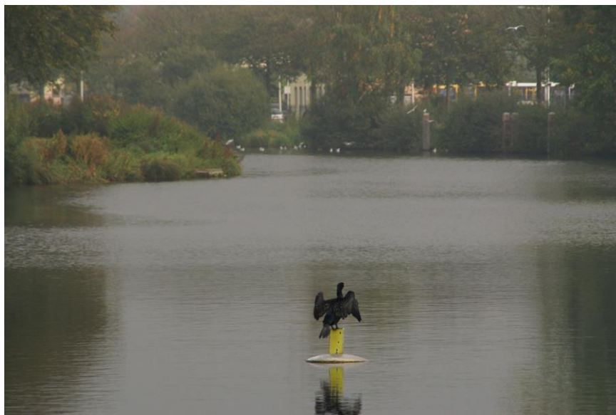
Drogende Aalscholver Piushaven

Terwijl een deel van onze broedvogels in de winter naar het zuiden trekt, krijgen we bezoek van duizenden Aalscholvers die hun kolonies hebben in het Oostzeegebied en Noord-Duitsland. Zij brengen hun wintertijd graag door in onze stadse wateren. In de Reeshof, langs het Wilhelminakanaal en in de Piushaven lijkt de viskraam goed gevuld.