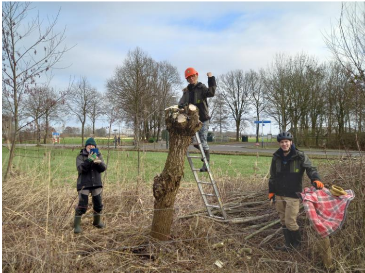
Knotbomen zijn belangrijke landschappelijke elementen