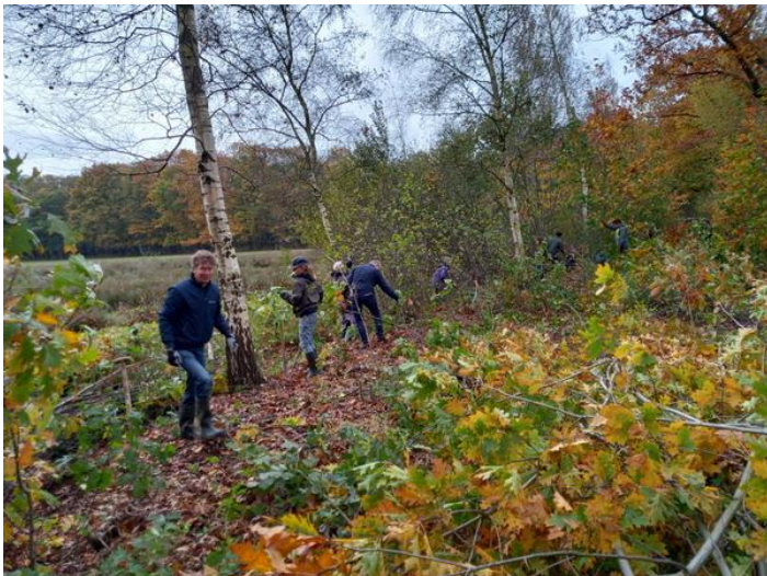
Op tijd even tijd nemen om te kijken hoe mooi de omgeving is.