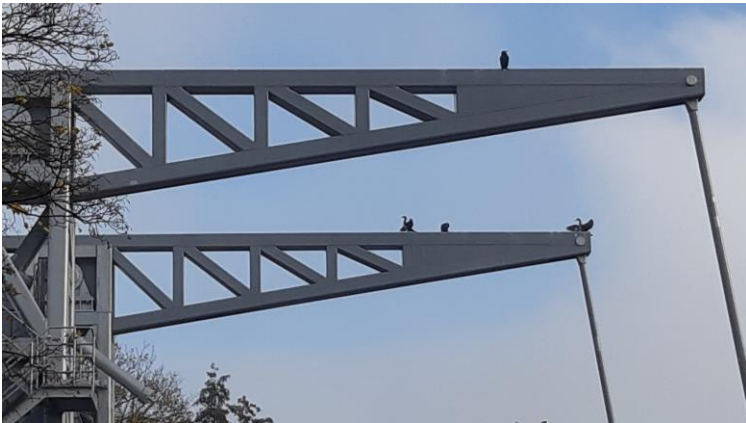
Aalscholwers op Den Ophef

Een heerlijke nieuwjaarsduik levert weer een lekkere portie vis op. De kwaliteit van het water en ook het zicht onder water is de laatste jaren sterk verbeterd, waardoor er heel wat vissoorten opgevisst worden. Zoals zijn naam al aangeeft at hij vroeger veel Paling, oftewel Alen. Die zijn er hier wat minder en dus slokt hij vooral Baars, Voorntjes en Brasems op. Hij lust er wel een pond van per dag. Om die te pakken te krijgen zwemt hij onder water met hulp van zijn zwemvliezen en zijn vleugels. Hij duikt tot wel 10 meter diepte. Om die diepte te bereiken zorgt hij voor zo min mogelijk lucht tussen zijn veren. Zou hij daarbij ook nog eens mooi ingevet gaan jagen, dan wordt hij eigenlijk weer naar boven gedreven. Dat wil hij liever niet. Zijn verenpak wordt dan ook helemaal nat, en na een duik moet dat weer gedroogd worden. Daarbij in de stad op de grond gaan zitten is toch te gevaarlijk. Dus zo snel mogelijk zoekt hij een plekje op een lantaarnpaal, boom of gebouw. De vleugels worden uitgespreid en de door de veren waaierende wind zorgt voor een natuurlijke föhn.