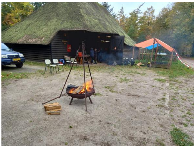
De werkschuur van Brabants landschap is de uitvalsbasis

We zijn dit jaar weer neergestreken op de Ooievaarsnest. Een gevarieerd natuurgebied ten zuiden van de Regte heide. In de bosranden van dit gebied komt veel Amerikaanse eik en Amerikaanse vogelkers voor. Deze soorten hebben soms wat invasieve eigenschappen. Door het invasief gedrag verdringen ze de inheemse planten en dat leidt tot verarming van de biodiversiteit. Het aantal deelnemers is dit jaar opengesteld voor 60 deelnemers. Uiteindelijk hebben 68 mensen deelgenomen, dus meer dan opgegeven. Dat komt omdat er spontaan onaangemelde deelnemers zijn meegekomen met aangemelde deelnemers. Met de voorspelde regen zou het niet vreemd zijn als er een paar afmeldingen zouden komen. Niets van dit alles. Een enkele ziektemelding uitgezonderd is iedereen op komen dagen.