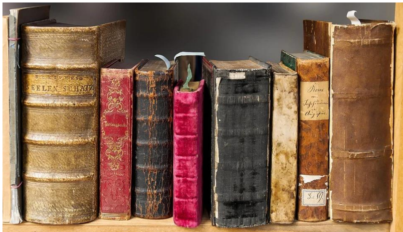
Zulke mooie boeken als op deze foto zitten er niet in .....