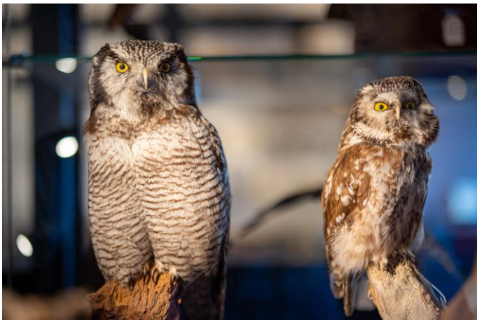
Met de KNNV-pas kun je deze uilen gaan bekijken in Natuurmuseum Brabant

Sinds de oprichting van onze afdeling in 1937 is er een sterke band met Natuurmuseum Brabant. We hebben daar ons onderdak voor de avondactiviteiten zoals werkgroepen, cursussen en lezingen maar ook zijn ruim 20 leden actief als conservator en werken aan de collectie. KNNV-leden van de afdeling Tilburg hebben, op vertoon van de speciale KNNV-pas, gratis toegang tot het museum. Deze pas treft u aan als bijlage bij de mail van deze Oude Ley nr. 1 en kan digitaal meegenomen worden. Mocht u een papieren versie nodig hebben van deze pas, neem dan contact op met het secretariaat ✉ secretaris@tilburg.knnv.nl .