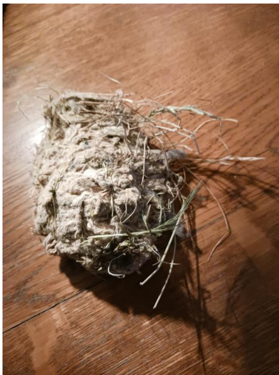
zachte bol uit nestkast

De kast hangt dus niet zo hoog en ondertussen zijn er al wel huismussen ingetrokken. Omdat de dakgoot schoongemaakt moest worden, heeft ze wel een echte 'ladderman' gevraagd om dit te doen. Tegelijkertijd heeft hij het nestkastje schoongemaakt. Er kwam een enorm pak nestmateriaal uit, veel gras en een zacht bolletje dat aan de deksel geplakt zat. Die bol (zie foto) is zacht, sponsachtig en ongeveer 10 cm lang, 7 cm breed en 3 cm dik. Er zat ook gras in verwerkt, maar Mariëtte kon er geen insecten of iets dergelijks in vinden. Maar ze is ontzettend benieuwd wie de bol heeft gemaakt en waarom die tegen de deksel van de kast zat. Hopelijk hebben jullie daarover vast verfrissende ideeën. Mariëtte en ik horen die graag.