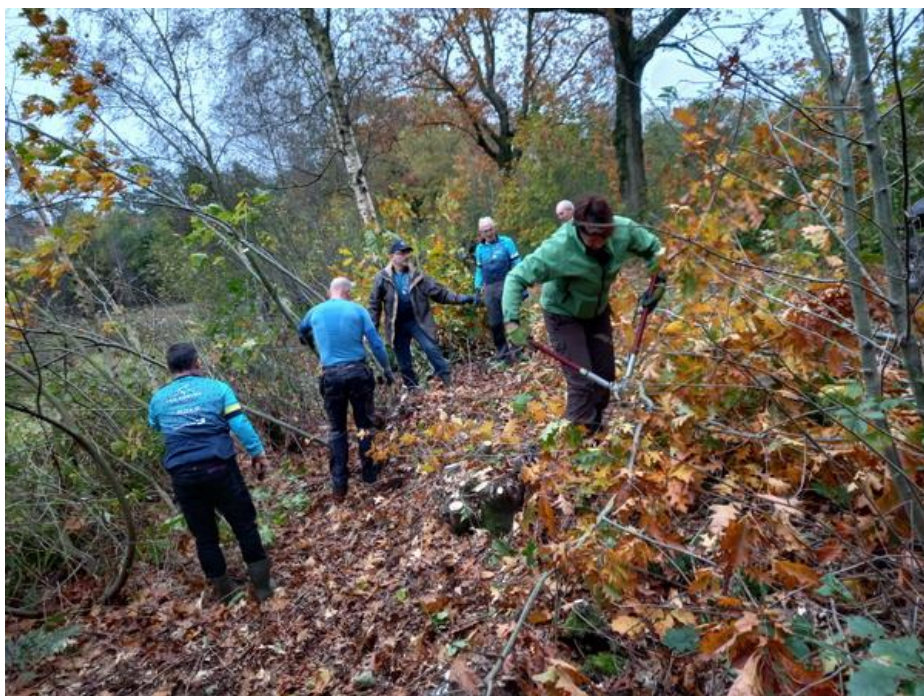
De fietsgroep heeft er zin in.

Rond 2 uur kwam het eind van de werkzaamheden langs het weijtje in zicht. De meeste deelnemers reichten hun rug en overzien tevreden het resultaat van de arbeid. Er is altijd wel een deelnemer die niet van ophouden weet. Zijn maten van de fietsclub hebben hem met enige 'chanterende argumenten' doen bewegen om zijn zaagje toch maar in te leveren. De lichte regen die tot dan toe veel heeft zich kennelijk ingehouden tot het einde van het werk. De druppels werden talrijker en dikker. Er wordt gezamenlijk besloten dat we niet meer gaan starten op de 2 e locatie in het bos. In de werkschuur en de schuiltent wordt nog van een kopje koffie genoten en de ervaringen van vandaag uitgewisseld.