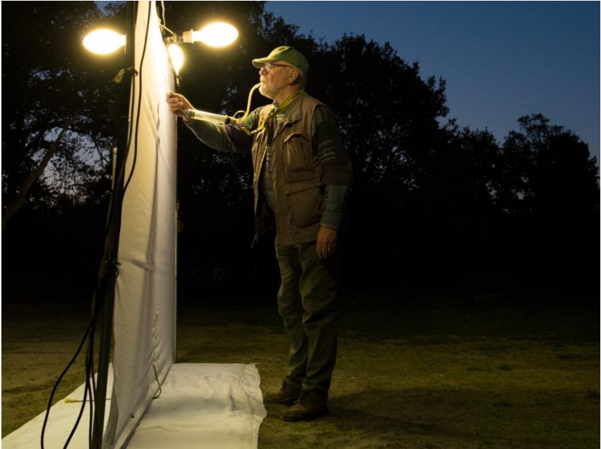
Lezing: Hoe staat het met onze insecten?