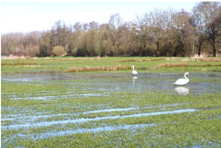
Knobbelzwanen op nieuw plasdras in de Lange Rekken

De in de titel vermelde natuurterreinen betreffen alle natuurontwikkelingsgebieden, de één aangelegd midden 80-er jaren van de vorige eeuw (De Rekken) of ingericht aan het begin van deze eeuw (Dongevallei). Van andere is de aanleg pas twee of drie jaar geleden afgerond (Reeshofweide, Koeweiden, Lange Rekken). Feit is dat het ecologisch gezien allemaal nog relatief zeer 'jonge natuurgebieden' zijn. De successie (natuurlijk proces van opvolging van kenmerkende levensgemeenschappen in een bepaald habitat) verkeert in verschillende stadia van ontwikkeling: van kaal pioniersstadium tot gesloten elzenbroekbos. Dat maakt het zeer afwisselend en interessant. Het betekent echter ook dat de monitoring van flora en fauna van genoemde gebieden qua frequentie en intensiteit een zeer verschillende geschiedenis kent.