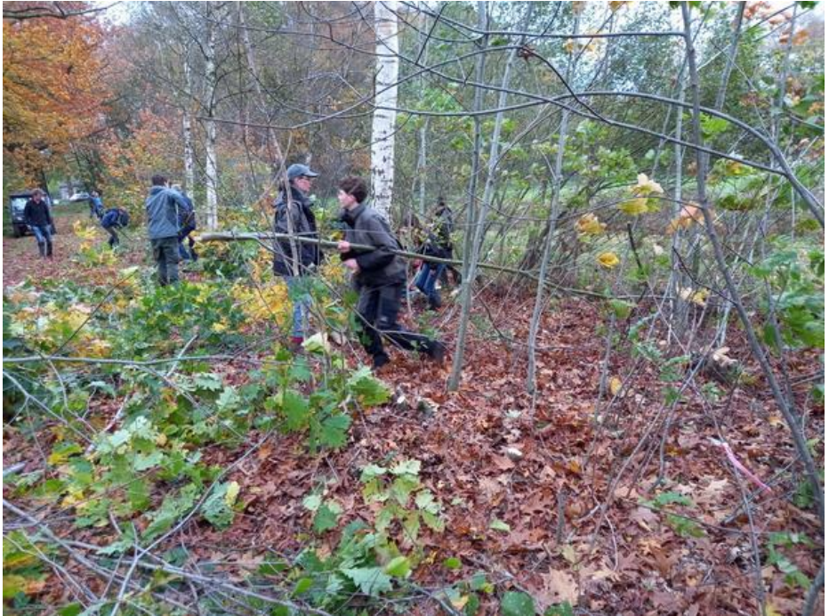
Door het wegnemen van de Amerikaanse eik krijgen andere planten meer ruimte.

Ondanks dat we zo goed mogelijk hebben geprobeerd om alle planten een merkje 'Mij niet omzagen' te hebben gegeven, zijn er toch best wel wat over het hoofd gezien. Dus er wordt wel een paar keer aangegeven 'oeps die mocht er niet uit, zet maar terug'. Zonder gemopper wordt de plant dan weer teruggezet. Fijne mensen die "Natuurwerkdagers".