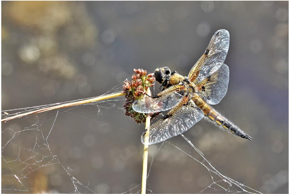
Viervleklibel langs sloot in de Koeweiden

Natuurmonitoring door burgers ( citizen science ) is vanzelfsprekend vrijwillig, maar niet altijd vrijblijvend. Zeker al je meedoet aan een landelijk meetnet (Netwerk Ecologisch Monitoring – NEM). Voor mij geldt altijd dat ik het naast zinvol en belangrijk, vooral ook leuk moet vinden. In het aangekondigde boek is ook een soortenregister opgenomen. Die totaal-soortenlijst is (als de vormgever er mogelijkheden toe ziet) onderverdeeld naar deelgebied en met een scheiding in de periode vóór en ná 2020. Momenteel staat de teller op 3098 gerapporteerde en gevalideerde soorten. Het aantal dat in het Kaaistoep-boek van dat gebied is beschreven, wordt vanzelfsprekend niet gehaald, maar dat is ook niet het doel. Het is sowieso niet mogelijk om voor alle soortengroepen ook maar een klein beetje volledig te zijn. Ik zou het echter wèl leuk vinden als de bewezen soortenrijkdom van de Dongelanden nog wat opgeschroefd kan worden. Ik werk daar zelf hard aan, maar vind het ook leuk om dat samen met anderen te doen. Al was het maar één gezamenlijke veldexcursie of een paar dagdelen door het veld struinen om tot een soortenlijstje te komen. Mijn NAW-gegevens zijn bekend (zie colofon Oude Ley); een telefoontje komt nooit onverwacht. De deadline is 31 dec. 2024.