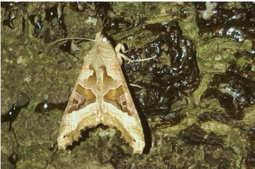
Agaatvlinder op stroop op eikenboom

Tijdens al deze inventarisaties wil ik via Obsidentify-Waarneming.nl de soortenrijkdom aan insecten een beetje in beeld brengen. Met name wil ik proberen (en mensen uitnodigen) om aandacht aan de keverfauna te besteden. Het is een gevarieerd loofbos met veel staand en liggend dood hout. Misschien vinden we in de oude populieren-opstanden wel de prachtige Vermiljoenkever, die niet ver van De Rekken al in een bosje in de Reeshof is aangetroffen. Tenslotte ga ik een herhaling uitvoeren (max.12 nachten) van de nachtvlinderinventarisaties die een paar jaar geleden 'op-licht' zijn uitgevoerd.