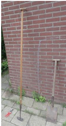
Snoeischaar, schop en spa