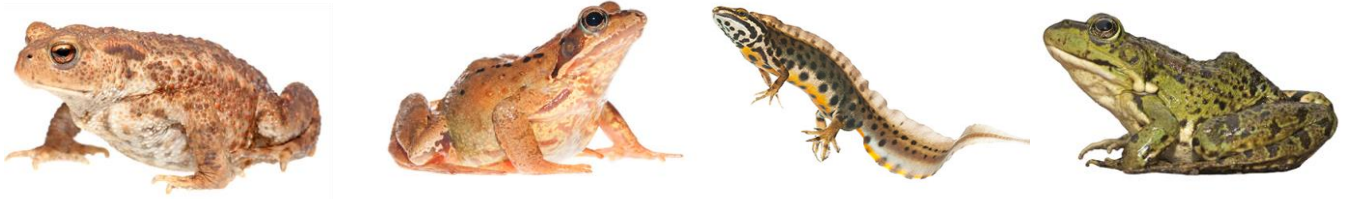
Figuur van links naar rechts. Gewone Pad (Bufo bufo) / Bruine Kikker (Rana temporaria) / Kleine Watersalamander (Lissotriton vulgaris) en Groene Kikker (Pelophylax)