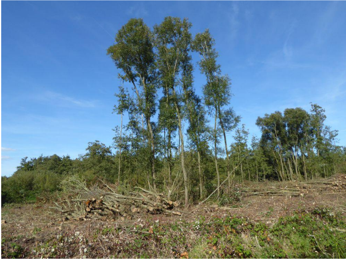
Losse boomgroep bij noodkap in het Bieslandse Bos