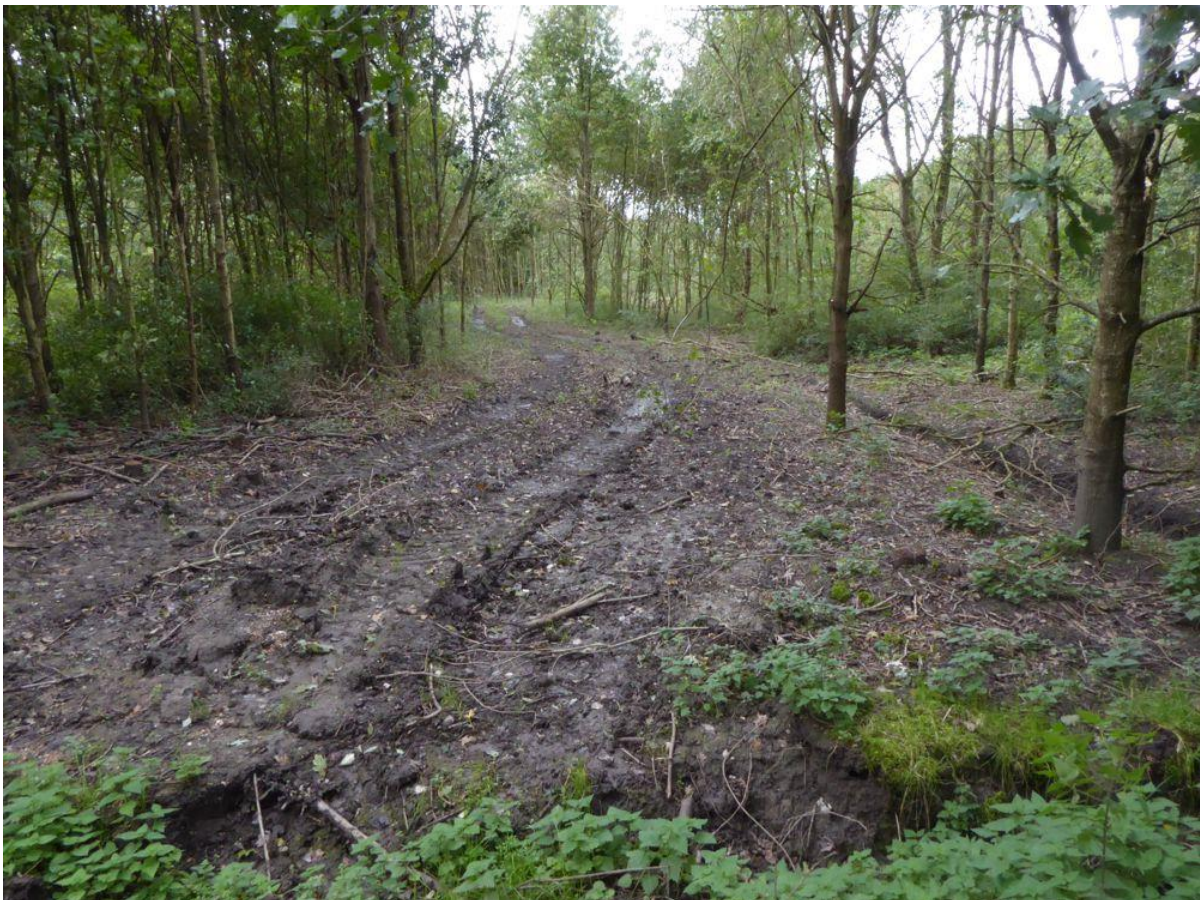
Noodkap van es in het Abtswoudse Bos Oost

Het Abtswoudse Bos oost is heel divers aangelegd. Daardoor is grootschalige verwijdering van de es niet erg opvallend.