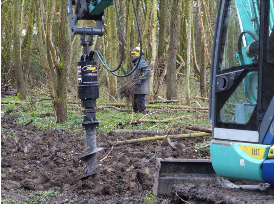
Boren van gaten voor boomaanplant in Abtswoudse Bos Oost.

Bij de aanplant van nieuwe bomen worden er gaten geboord om jonge aanplant in te zetten. Bij de opslag van nieuwe bomen op een parkeerterrein, die klaar lagen om te worden aangeplant, was te zien dat het een heel divers sortiment betrof. Ook met soorten uit zuidelijker streken die hogere temperaturen aankunnen (zie foto volgende bladzijde). Het Bieslandse Bos bij het Krekengebied kende grote percelen met essen. Hier en daar stonden er groepjes andere bomen en dat geeft na de kaalkap een raar beeld. De jonge aanplant heeft concurrentie van de woekerende dijkviltbraam. Hopelijk winnen de boompjes het. (zie foto volgende bladzijde)