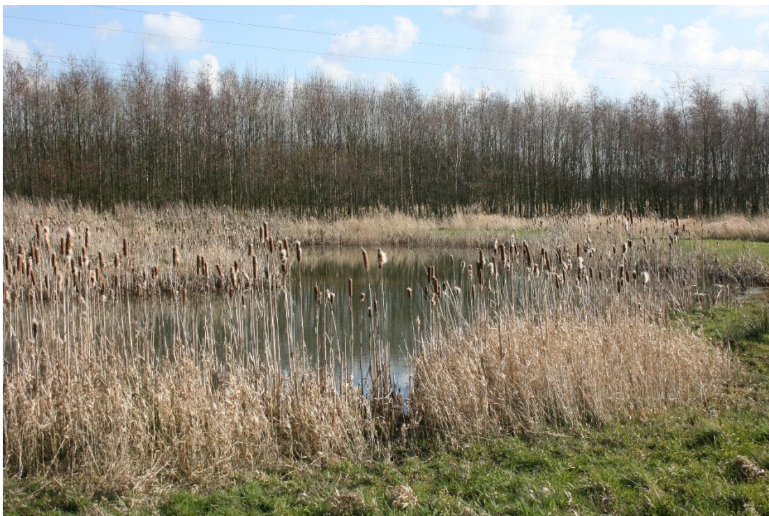
Figuur 1 Abtswoudse Bos Vlinderbiotoop Delft. Grote Poel.