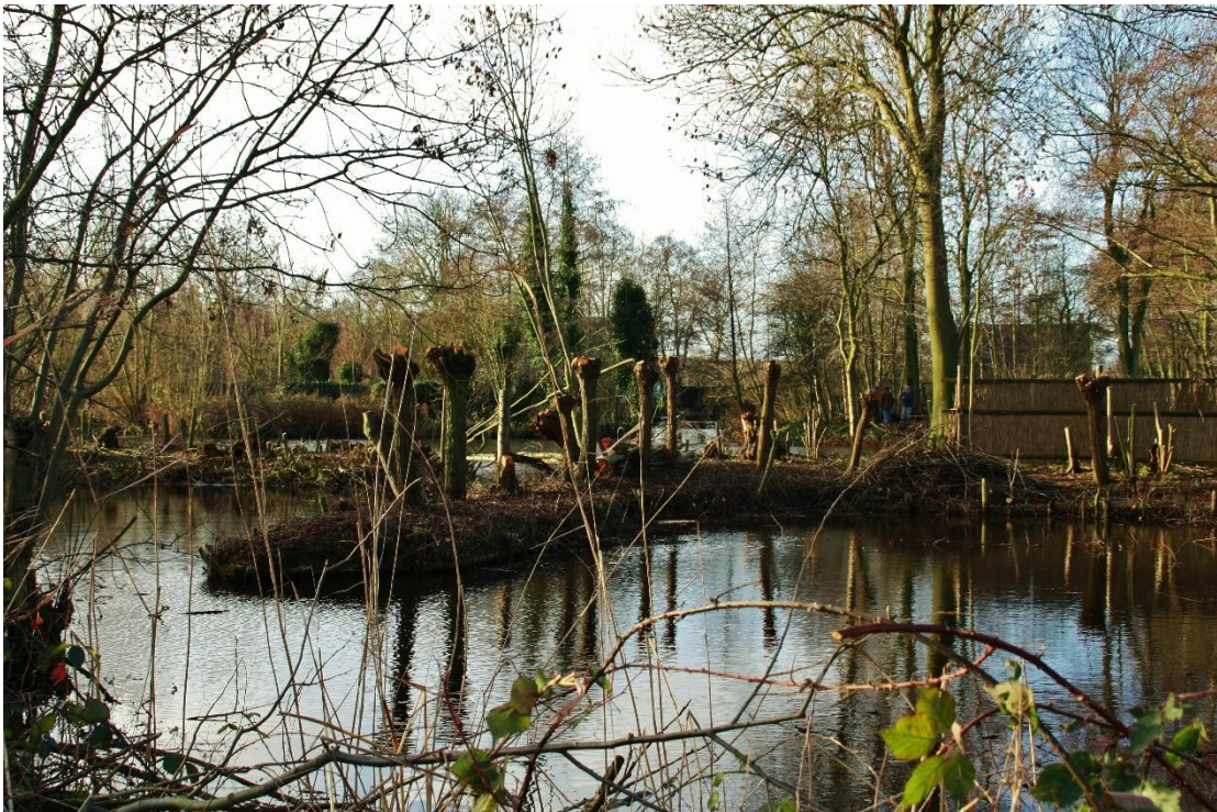
Figuur 4 Eendenkooi Groeneweg Schiedam. Kooiplas.

Deze voormalige kleiput is de derde kleiput uit 1845. Hier is het successiestadium gelijk aan het Spoorbos Mandjeskade namelijk een elzenbroekbos (zie figuur 4). De kleiput is decennia beheerd door de familie Bijl, die toen en nog steeds met een aantal gezinnen woonachtig is in het nabijgelegen Kandelaar. De kleiput is omgevormd in een eenarmige eendenkooi. Ruimte voor een gebruikelijke vijfarmige eendenkooi was er niet. Laatste eigenaar/gebruiker was Wim van de Burg, die na het stoppen op de Groeneweg een nieuwe eendenkooi in Maasland heeft aangelegd. Kooiplas met eilandjes en vangpijp met kooikerschuurtje zijn nog steeds in tact. De vangpijp vereist groot onderhoud. Natuurlijk Delfland heeft geadviseerd aan de Dienst Landelijk Gebied tijdens de inrichting. Toen is de kooiplas in zijn geheel uitgebaggerd. Deze bagger is in depot gegaan op het naastgelegen natte weiland. Deze baggeropslag heeft zich ontwikkeld tot een wilgengriend met diverse soorten wilg. Natuurlijk Delfland onderhoudt en monitort de Eendenkooi en het Wilgengriendje. Inventarisaties zijn beschikbaar.