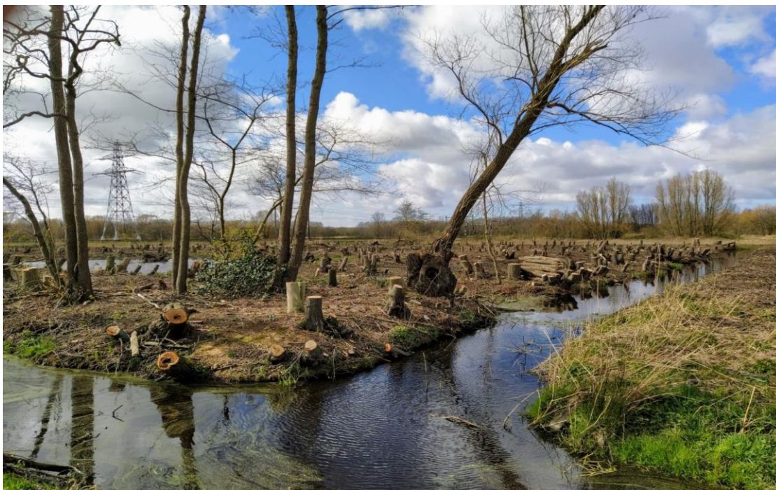
Figuur 2 Spoorbos Mandjeskade Schipluiden na de kap in 2021.

Langs de spoordijk die in 1845 is aangelegd liggen een drietal voormalige kleiputten die bij de aanleg gebruikt zijn om klei uit te steken ter bescherming van het spoortalud dat uit zand bestond en anders kon wegwaaien. Vanuit het noorden gezien is dit de eerste. Dit Spoorbos Mandjeskade heeft zich ontwikkeld als een waardevol elzenbroekbos met daarin nog steeds zichtbaar een vijver. Lange tijd heeft het ook gefunctioneerd als een zogenaamde schietkooi en geriefhoutbosje.