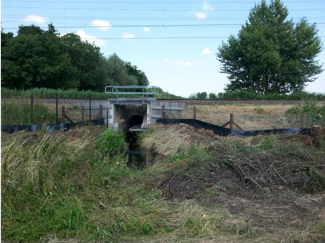
Figuur 5 Wildbegeleidende onderdoorgangen langs het hele tracé

Langs het hele traject Delft-Schiedam heeft Prorail bij elke onderdoorgang een reeks van voorzieningen geplaatst om de uitwisseling van zoogdieren te faciliteren. Het verdwijnen hiervan zou onacceptabel zijn. Zie figuur 5.