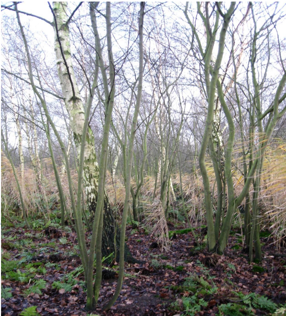
Figuur 3 Rietput Natuurmonumenten Schipluiden. Berkenbroekbos met hoogveenvorming.

Deze voormalige kleiput is de tweede kleiput uit 1845. Deze biotoop heeft zich, anders dan het elzenbroekbos aan de Mandjeskade, in de loop van de 175 jaar ontwikkeld als berkenbroekbos; een zuurder successiestadium van het elzenbroekbos (zie figuur 3). Hier groeien vooral berken en er is ondanks de recente verdroging nog steeds sprake van in onze regio zeldzame hoogveenvorming. Natuurlijk Delfland monitort en onderhoudt dit berkenbroekbos. Inventarisaties zijn beschikbaar.