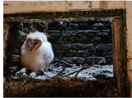
Eén van de jonge kerkuilen in de schoorsteen bij Rockanje

Soms blijken uilen niet geïnteresseerd in de kast die we voor hen opgehangen hebben en broeden ze wel in de schuur maar niet in de kast. Bij Rockanje konden we zo'n nest toch ringen omdat ze onderin een ongebruikte schoorsteen bleken te broeden.