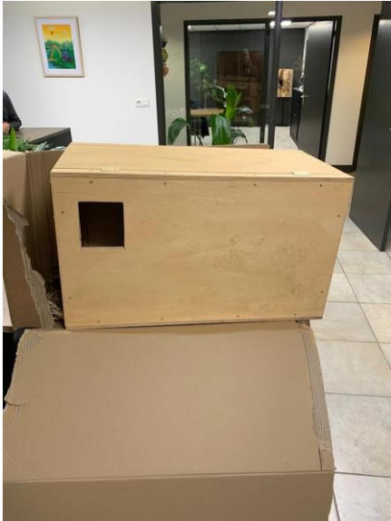
Een van de gesponsorde kasten