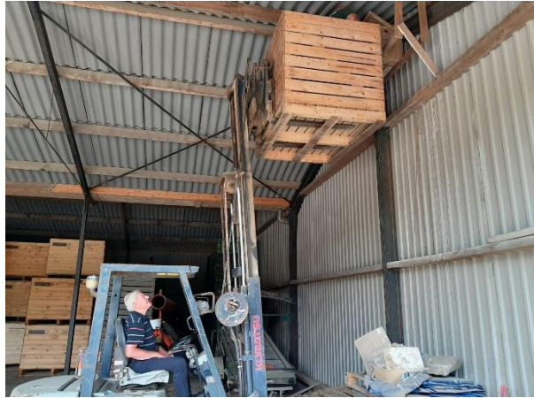
Met de hoogwerker naar boven