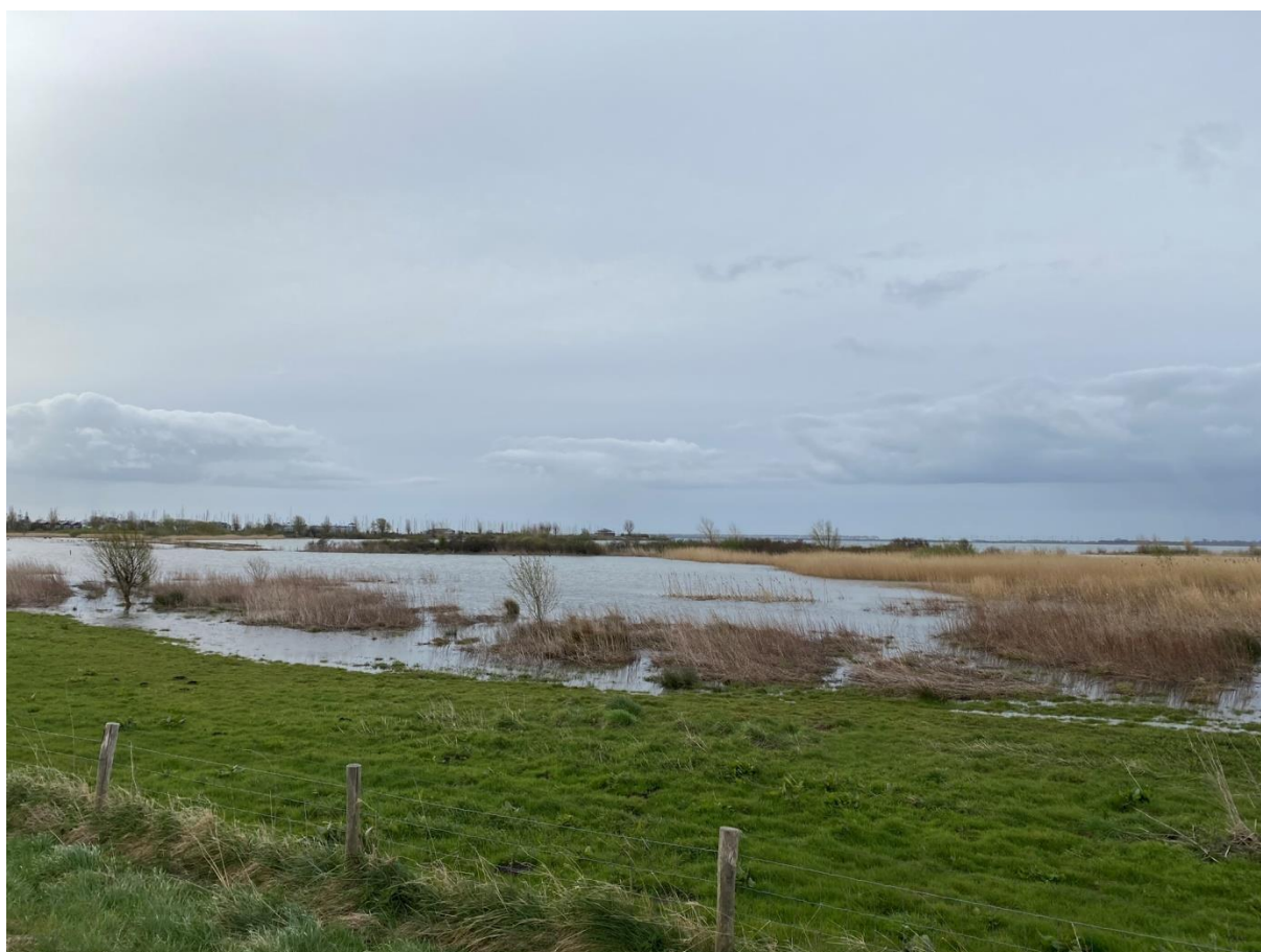
Hoogwater op het Quackgors.