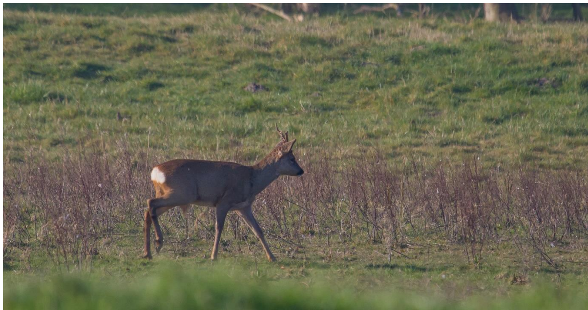
Reebokje in de ochtendzon.