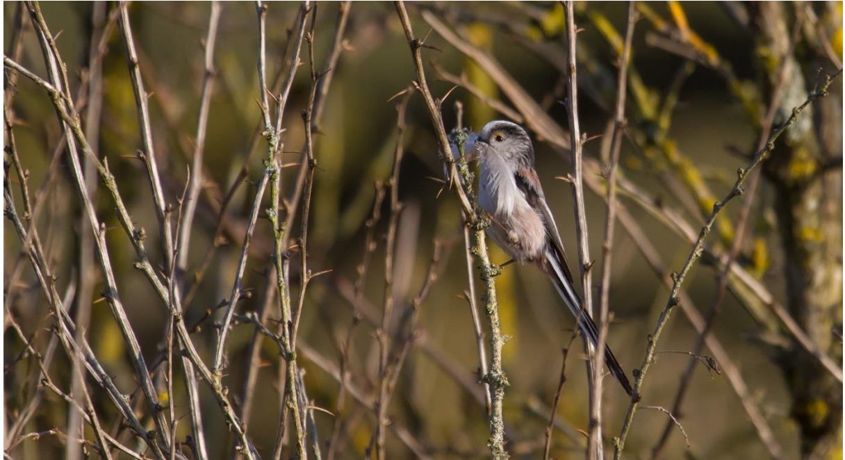
Staatmees met nestmateriaal.