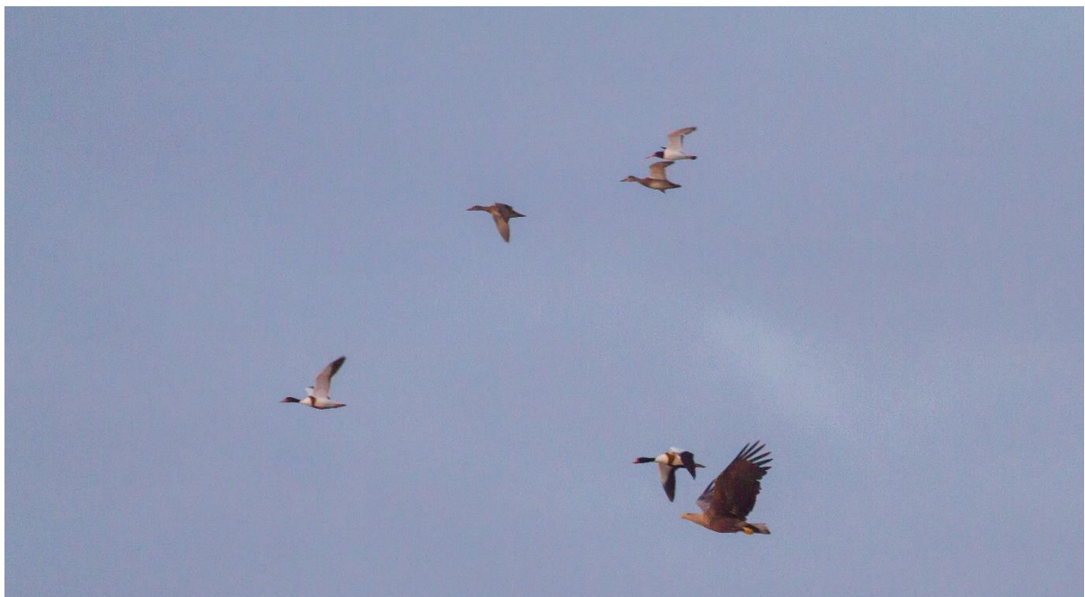
Zeearend komt regelmatig langs om te jagen.