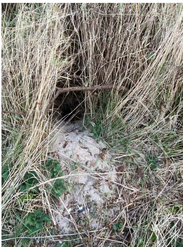
Vossenhol? Hier geen activiteit waargenomen.