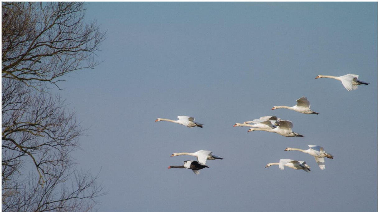
Het Quackgors is ook een belangrijk rust en foerageergebied voor zwanen. Hier knobbelzwanen met een zwarte zwaan in hun midden.

Positieve berichten zijn er dit jaar ook weer te melden. De ganzen deden het goed dit jaar. Grote Canadese gans maakte van het gebied gebruik om te broeden. De brandgans, vorig jaar nog maar één territorium, was nu goed vertegenwoordigd met negen territoria en de grauwe gans verdubbelde de territoria van drie naar zes. De krakeend was ook weer aanwezig met vier broedpaar. Een territorium waterral en waterhoen zijn zeker het vermelden waard. Ook dit jaar hebben we de cameraval weer opgehangen maar dit heeft geen bijzonderheden opgeleverd. Er waren vooral veel reeën te zien en af en toe liet de vos zich vastleggen.