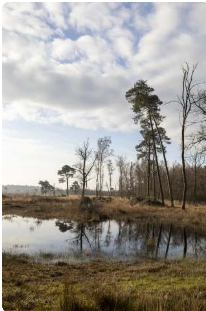
Wooldse Veen - Lisette Platjouw

Natuurlijk moet er ook een foto van de prachtige Hollandse luchten bij zitten. Typisch Nederlands en beroemd geworden door de schilderijen van de Hollandse Meesters uit de Gouden Eeuw. Lisette maakte deze foto in het Wooldse Veen. Er is veel ruimte voor de lucht in deze foto, wat echt een sfeermaker is, samen met de weerspiegeling van de bomen in het water.