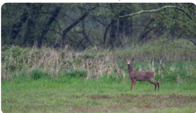
Aaltense Goor - Ellen van den Adel

Deze reebok werd door Ellen gefotografeerd in het Aaltense Goor. Het licht was mooi en de reebok nieuwsgierig. In de loopprijs van het dier is ruimte opengelaten, zodat het dier de foto als het ware inloopt en niet aan het einde van de foto van de rand af lijkt te vallen.