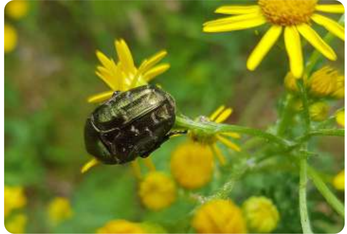
Gedeukte gouden tor.

Mannetje spin moet door middel van signalen duidelijk maken dat hij geen prooi is, maar wil paren, maar dat loopt niet altijd goed af.