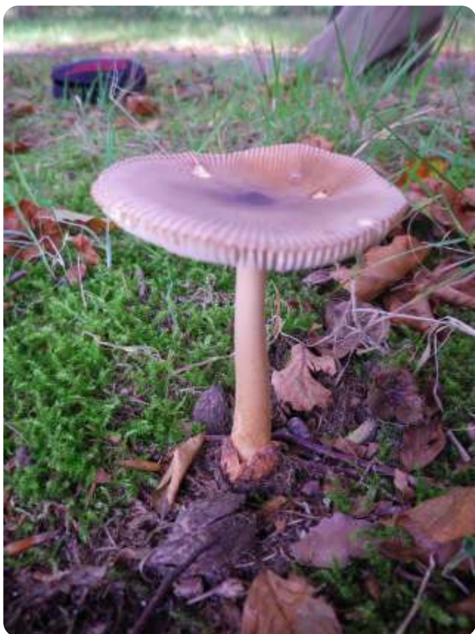
Roodbruine slanke amaniet