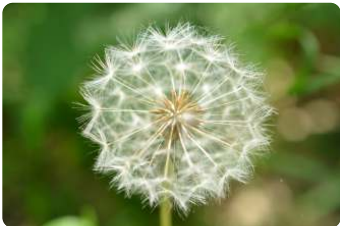
Needse Achterveld - Pieter Dorrestein

In het hart van deze paardenbloem is van alles te zien. Pieter heeft dit met oog voor detail prachtig weten vast te leggen: de vrucht, het eenzadig nootje en het gesteelde vruchtpluis waar het aan vast zit. Nog even en ze worden door de wind verspreid.