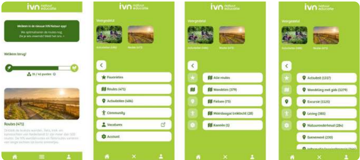
Screenshots van de IVN Natuur app

IVN heeft eind november de IVN Natuur app gelanceerd. Deze app vervangt de IVN Routes app.