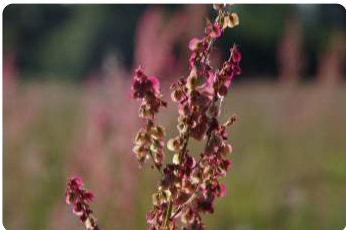
Grevengracht - Thea Croese

Deze veldzuring werd door Thea gefotografeerd bij de Grevengracht. De foto wordt bijzonder doordat de zuring scherp is op de voorgrond en nog eens vager wordt herhaald op de achtergrond. Bovendien steekt het rozerode van de zuring mooi af tegen de verschillende groentinten in de achtergrond.