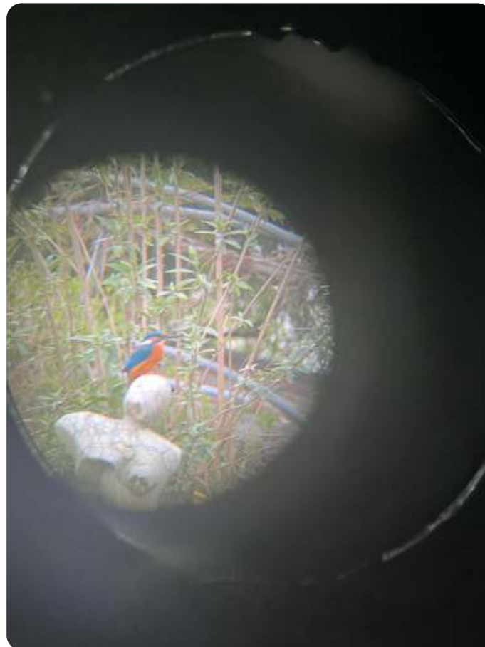
Ijsvogel gemaakt door de verrekijker