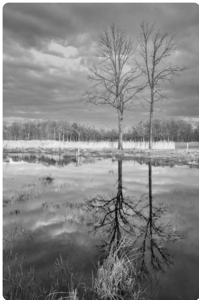
Wooldse Veen - Mario Bekke

Soms is een kleurenfoto mooi, maar is de zwart-wit versie prachtig. Met zwart-wit benadruk je de contrasten die al in de foto zitten en vallen licht en schaduw beter op. Zeker ook de weerspiegeling van de boom op de foto die Mario in het Wooldse Veen maakte benadrukt dit effect. Zwart-wit versimpelt het beeld, waardoor ook ongewenste details op de foto kunnen wegvallen.