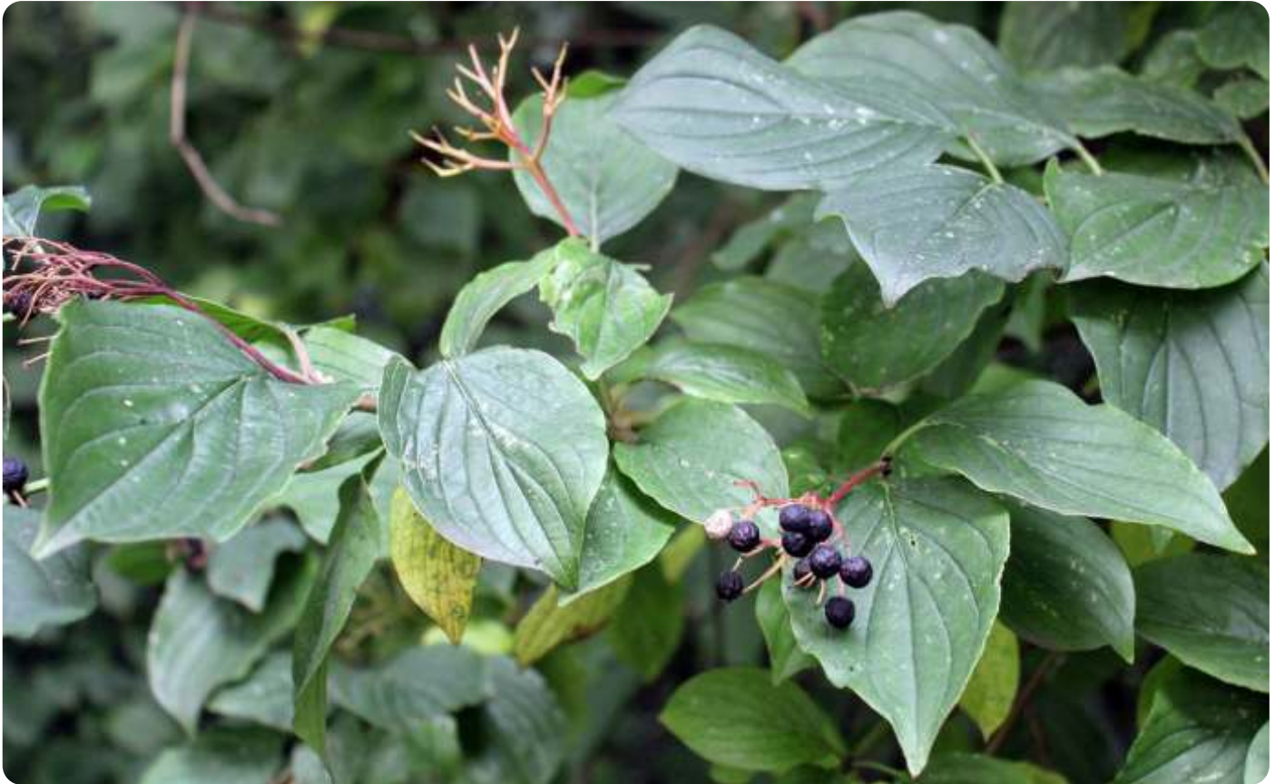
Rode kornoelje

De naam Besselinkschans is ook een verwijzing naar de Engelse Schans, die daar in 1627 werd gebouwd als onderdeel van het beleg en de verovering door de Staatse troepen onder leiding van stadhouder Frederik Hendrik van Oranje in de laatste fase van de 80-jarige oorlog.