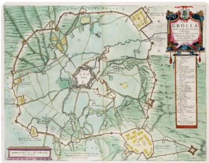
De omsingeling van Groenlo in 1627 rechts onderin de kaart zie je de Engelse Schans Door J.Blaeu - Atlas van Loon, Publiek domein

Groenlo was hierdoor geheel omsingeld en geen mens kon meer in of uit de vesting. Een vierde schans werd op een hooggelegen punt ten oosten van het grote kamp bij Lievelde gebouwd ter verdediging van dit kamp. Dit is de Engelse Schans.