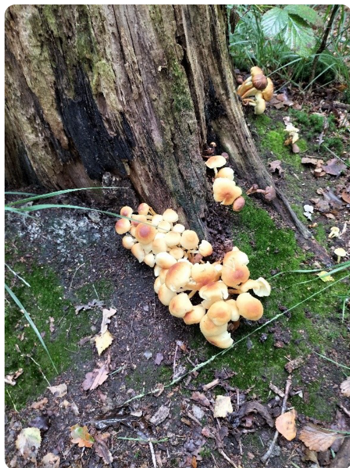
Gemaakt in Needs Achterveld

Reinier van den Berg maakt zich geen zorgen over een bui meer of minder, maar wel over het klimaat.