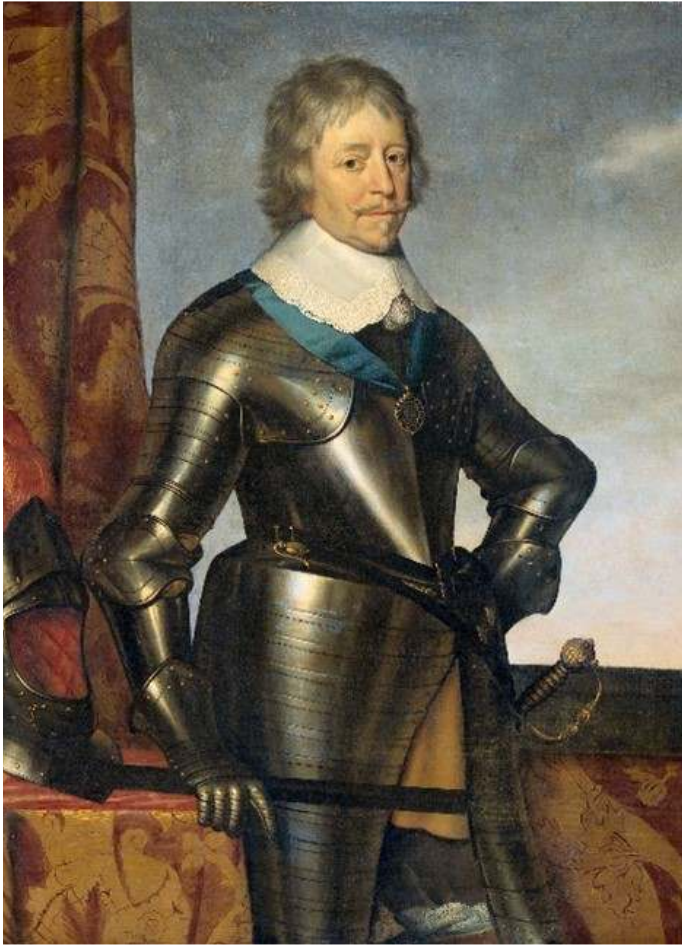
Stadhouder Frederik Hendrik van Oranje

Groenlo was hierdoor geheel omsingeld en geen mens kon meer in of uit de vesting. Een vierde schans werd op een hooggelegen punt ten oosten van het grote kamp bij Lievelde gebouwd ter verdediging van dit kamp. Dit is de Engelse Schans.