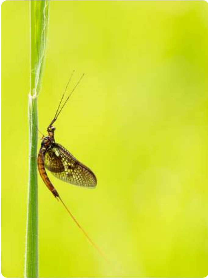
Needse Achterveld - Anouk Nijkamp

Deze prachtige foto van een insect werd gemaakt door Anouk in het Needse Achterveld. Door voldoende ruimte en een laag diafragma getal (f-getal) ontstaat er een kleine scherptediepte. Het onderwerp wordt scherp en alles eromheen vaag, waardoor het insect er echt uit springt.