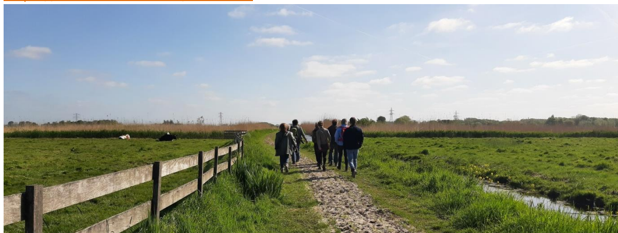
Excursie Woudhoek door vogelaar Wilco, 8 mei.

Meer details over al onze eerdere activiteiten, sinds 2021, vind je op https://rotterdam.knnv.nl/excursies