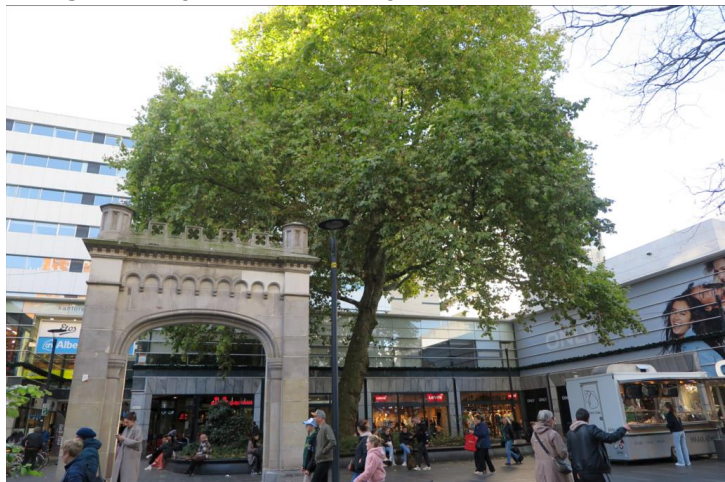
Lijnbaanplataan naast de poort van het voormalige Coolsingelziekenhuis