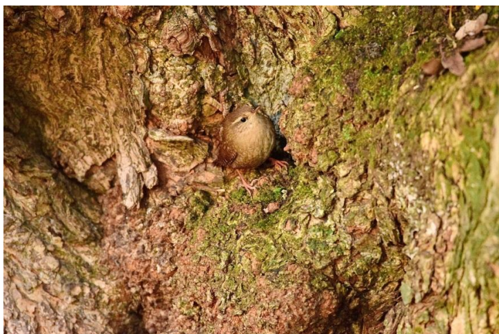
Winterkoninkje, Kralingse Plas.

Tijdens deze online workshop, via zoom, leer je hoe je kunt meewerken aan de Nationale Tuinvogeltelling. Welke vogels kun je in jouw tuin tegenkomen? Hoe herken je deze vogels? Wat kan je doen om je tuin vogelvriendelijker in te richten? Hoe meld je waargenomen vogels? Na aanmelding volgt een bevestiging en de link voor deze online bijeenkomst. Opgeven via natuurlijkrotterdam@knnv.nl .