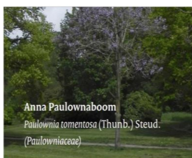
Anna Paulownaboom Paulownia tomentosa (Thunb.) Steud. (Paulowniaceae)