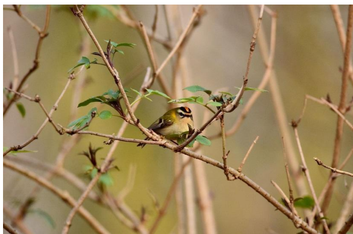
Vuurgoudhaantje, Kralingse bos.

Met de apps Birdnet, ObsIdentify of Plant.net kun je de mogelijke soortnaam van het organisme snel vaststellen. Meld jouw waarnemingen zelf via www.waarneming.nl . Stuur daarna de waarneming naar natuurlijkrotterdam@knnv.nl . Delen is weten.