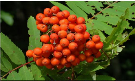
Sorbus aucuparia ssp. aucuparia 10, Wilde lijsterbes, Saxifraga-lan van der Straaten

Reizigers namen een klein takje van mij mee. Zij geloofden dat ze daardoor veiliger konden reizen. Mijn hout is erg hard en werd gebruikt voor o.a. meubels en keukengerei. 2022 was mijn mastjaar. Dat is een jaar waarin een boom extra veel vruchten heeft.