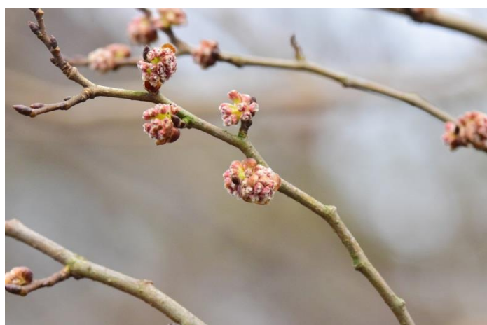
Tak met bloesem.