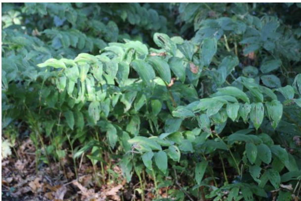
VEELBLOEMIGE SALOMONSZEGEL (Vaassen, Apeldoornseweg)