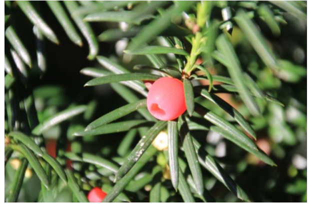
TAXUS, bes (Oene)