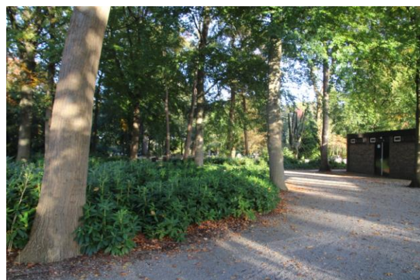
8. VAASSEN , Apeldoornseweg