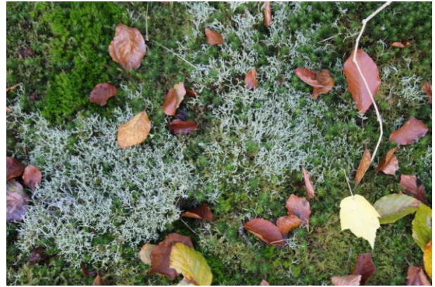
KORSTMOS, (Epe, Tongerenweg)