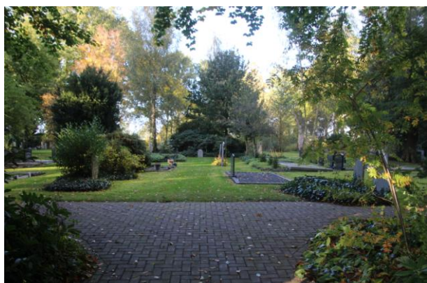
5. OENE , Eperweg