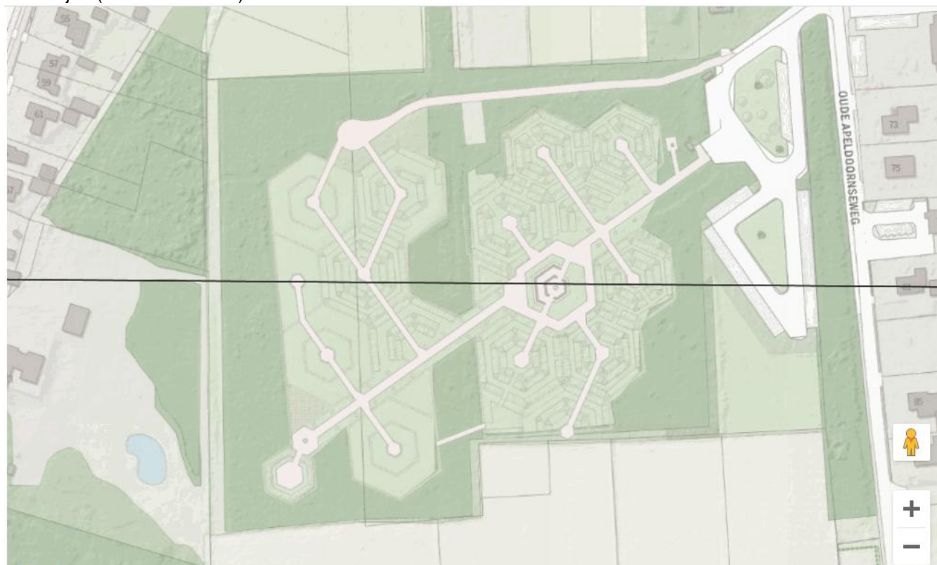
zuidzijde (km-hok 194-476)