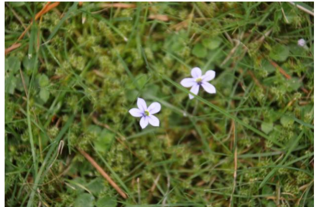
GRASLOBELIA, (Epe, Norelbos)