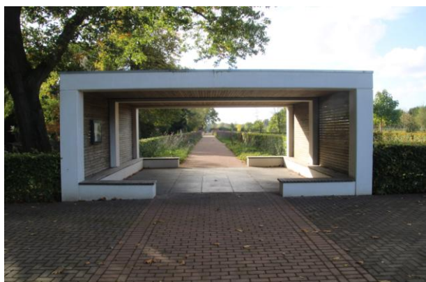
1. EMST , Kerkhofweg