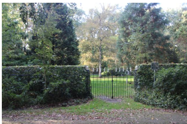
3. EPE , Tongerenseweg