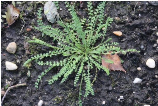
VOGELPOOTJE, rozet (Vaassen, Apeldoornseweg)