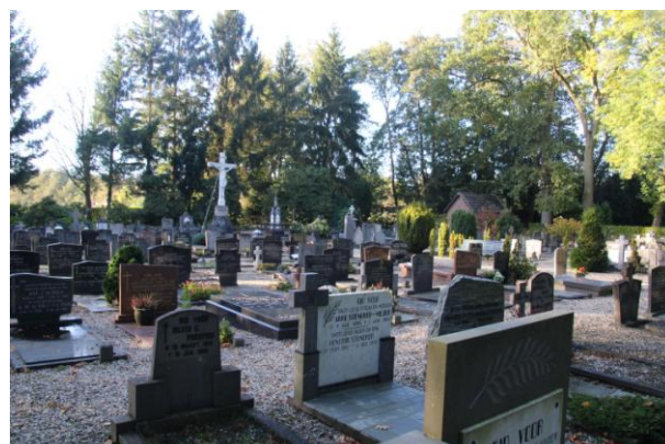
7. VAASSEN , Deventerstraat