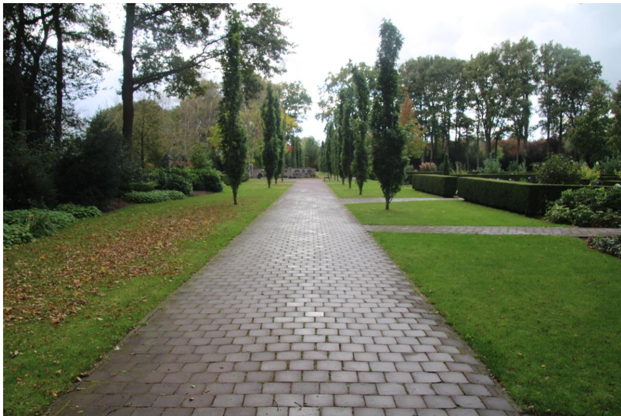
noordzijde (km-hok 194-477)