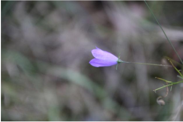
GRASKLOKJE (Vaassen, Apeldoornseweg)