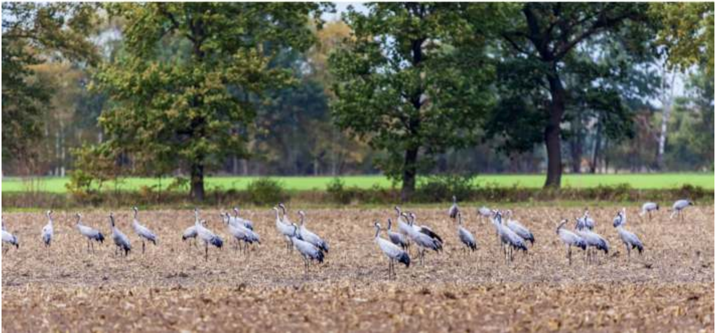
Groepje Kraanvogels op geoogste korrelmaisakker