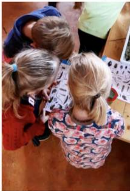
Tekst Herman Snoek