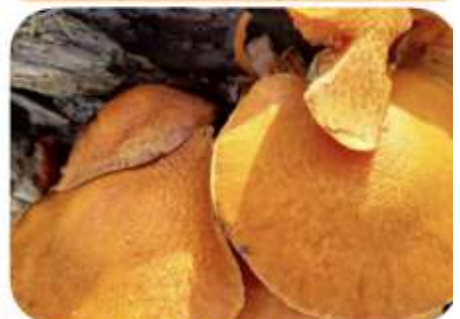
Prachtvlamhoed, Heerde Markluiden