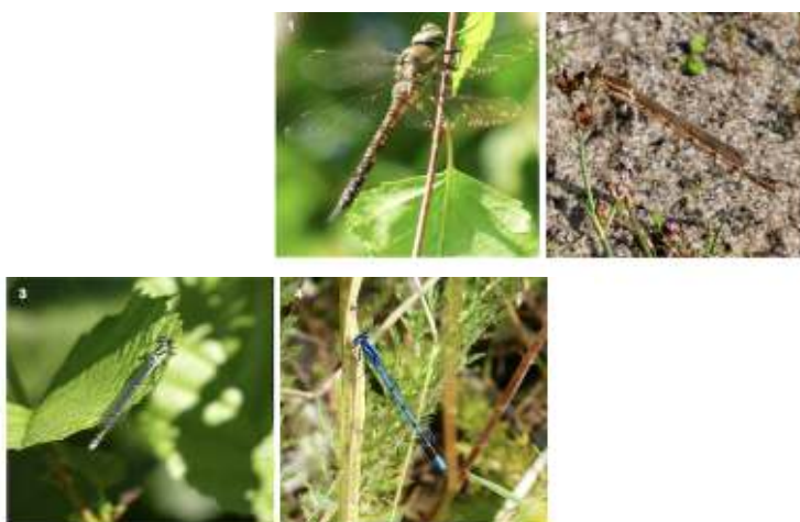
1) Paardenbijter 2) Bruine winterjuffer 3) Kleine roodoojuffer 4) Watersnuffel