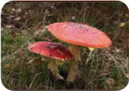
Vliegenschwam, Wapenveld Zwolsche Bos