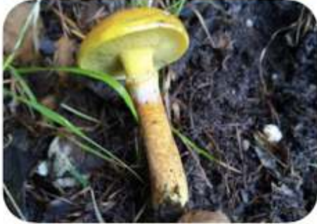
Gele ringboleet, Epe Renderklippen