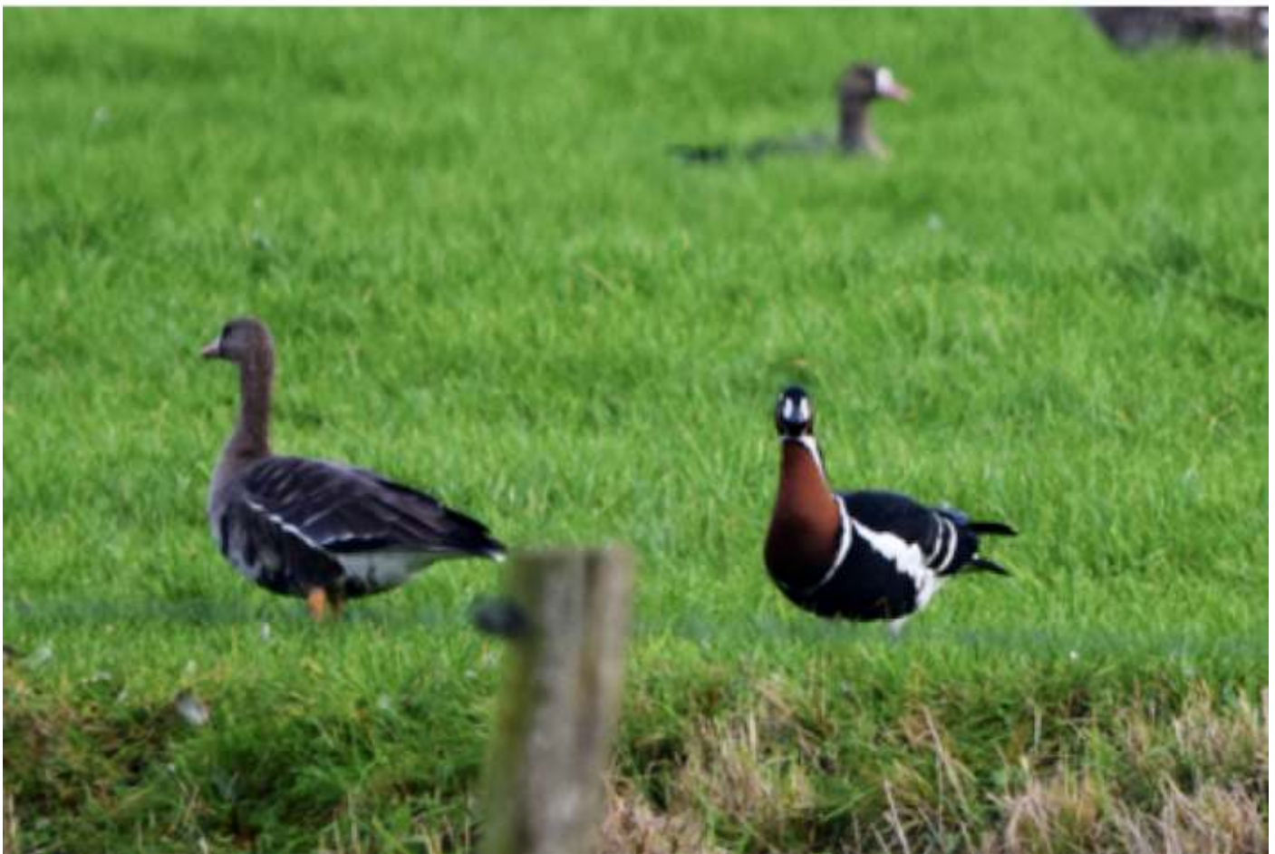
Roodhalsgans in groep Kolganzen in Wapenveldse Broek: 30 oktober 2022

Het blijft dus interessant om vogels waar te nemen in de broekgebieden langs de IJssel.