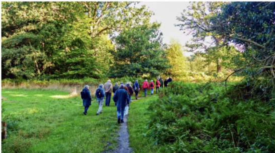
Wandeling op 4 oktober naar Sprengengebied

Zie voor informatie: wandeling van 7 februari 2023