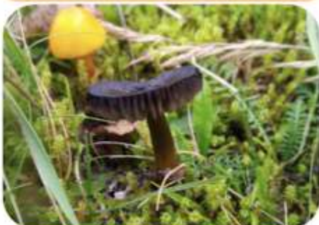
Zwartwordende wasplaat, Heerde De Dellen