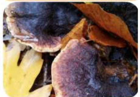
Teervlekkenzwam, Epe Renderklippen