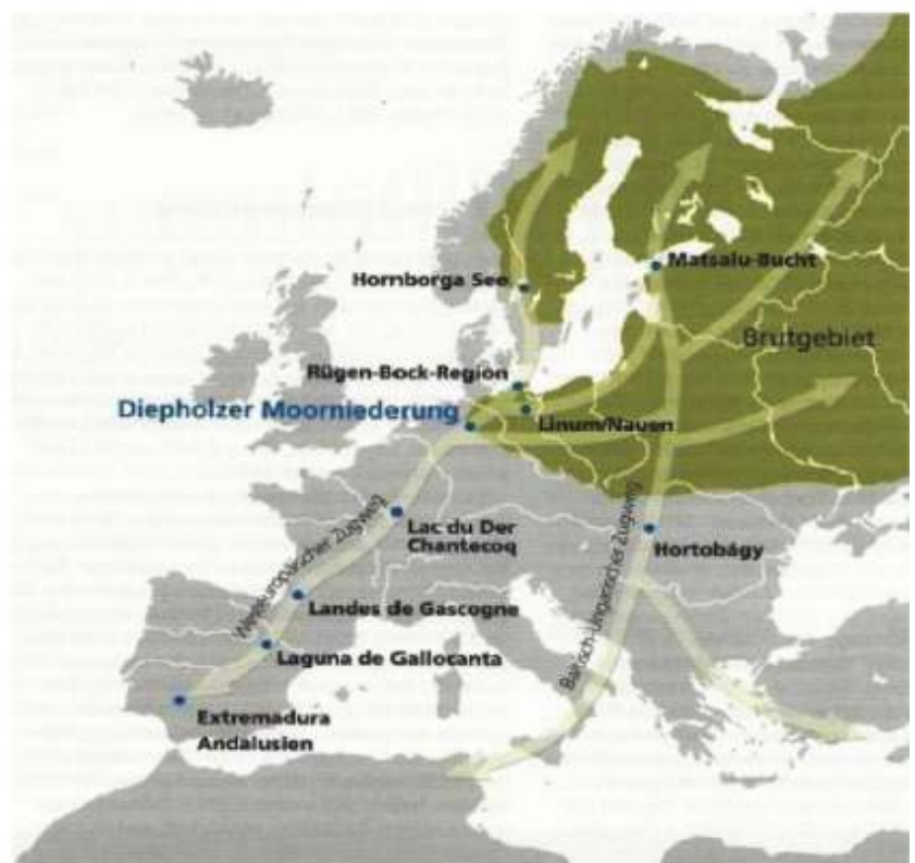
Overzicht pleisterplaatsen trekroute kraanvogels van broedlocatie naar overwinteringsgebieden

Hier vinden ze in de begraasde eikenbossen veel voedsel voor overwintering. In deze zogenaamde dehesa's vindt nog veel ecologische landbouw plaats.