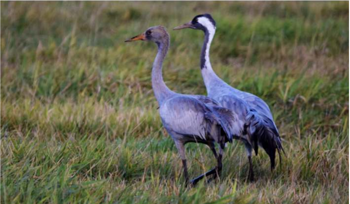
Adult en juveniel exemplaar Europese kraanvogel