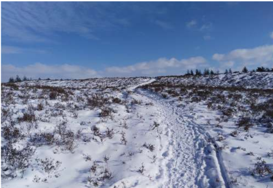
Landgoed Petrea

De redactie van Natuurklanken wensst u fijne feestdagen en een gezond 2023!