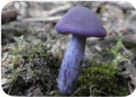
Paarse schijnridderzwam, Heerde Bakhuisbos