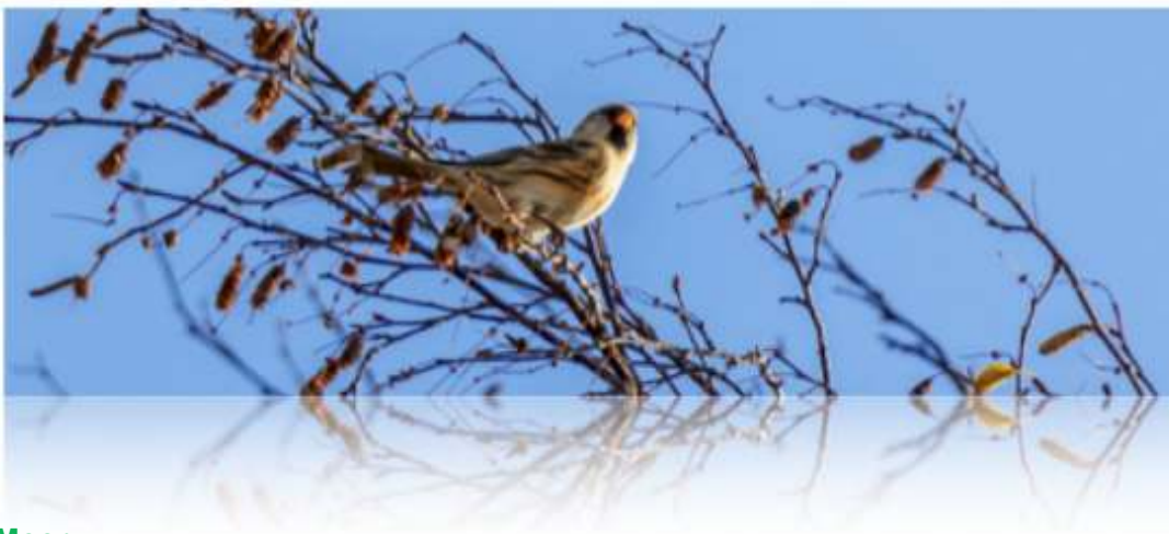
Kleine barsijs in het Oppenweher Moor

Wij verzamelen op de westelijke parkeerplaats in het Oppenweher Moor na enkele stops voor observaties van foeragerende Kraanvogels op de stoppels van geogoste maisvelden en kiemende wintergranen. Wij maken een wandeling naar een observatieplatform en genieten van een Klapekster en de aanwezigheid van Kleine barsijsen die goed herkenbaar zijn aan hun “metaalachtige” roepjes. In het Oppenweher Moor zijn veel wandelpaden die omzoomd zijn door Zomereiken en Vuilboom struwelen. Grote delen zijn begroeid met Pijpenstrootje en worden periodiek begraasd door schapen. Evenals in de overige hoogveengebieden, met een Natura 2000 status, vinden maatregelen plaats tegen verdroging en verbossing.