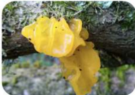
Gele trilzwam, Heerde Bakhuisbos