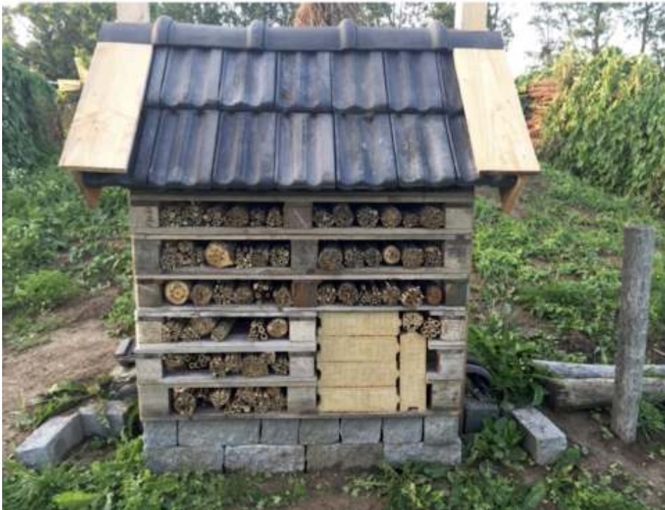
Insectenhotel - gemeente Heerde

Het zevende insectenhotel op de Beleefplekke in Veesen is gebouwd via een constructie met pallets. Voor particulieren die zelf ook een insectenhotel willen bouwen is dit een goedkope methode.