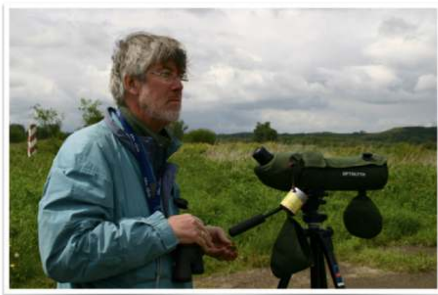
Vogelwerkgroep-lid van het eerste uur.