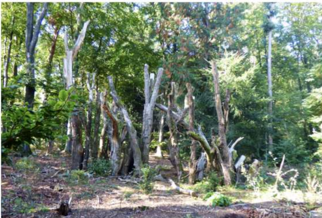
Broedstoof Natuurpark Berg en Bos

Bij een speciaal aangelegde broedstoof met eikenstobben (Stumpery) is nog weinig leven in de brouwerij. Een broedstoof bestaat uit een stapel dood vochtig hout, waar witrotschimmel kan gaan broeien. Rottend hout is essentieel voedsel voor de larven van het Vliegend hert.