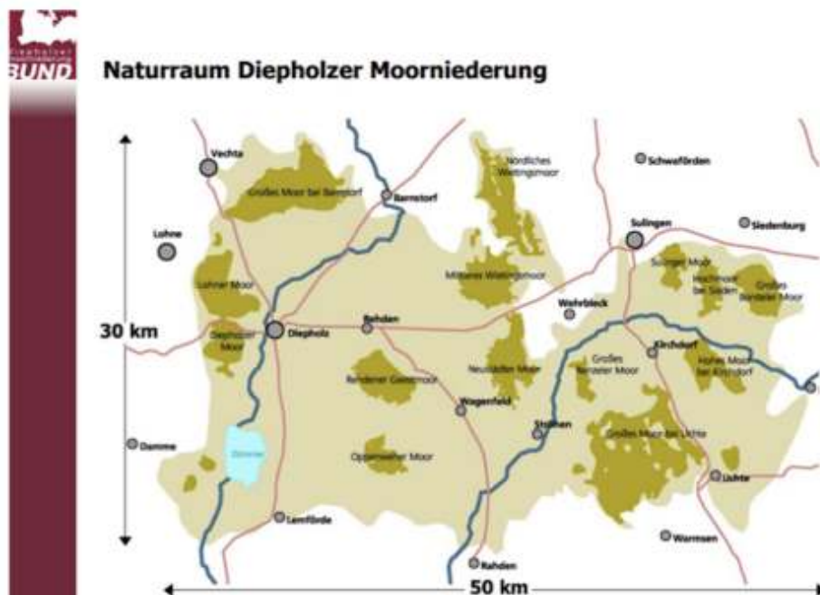
Overzicht van de 15 veengebieden in de Diepholzer Moorniederung

Het Rehdener Geestmoor is het meest bekende hoogveengebied voor de observatie van Kraanvogels. Door dit gebied loopt de Moordamm: “de kraanvogelpromenade”. Vooral in het weekend is het erg druk met vogelliefhebbers die hier Kraanvogels observeren die in het hoogveengebied een slaapplek hebben. Ook is er veel slaapplek van Kol- en Rietganzen die ook in het Rehdener Geestmoor een slaapplek hebben. Ruim 600 ha hoogveengebied reageert positief op de vernattings maatregelen en de hoogveenvegetaties herstellen zich in dit gebied.