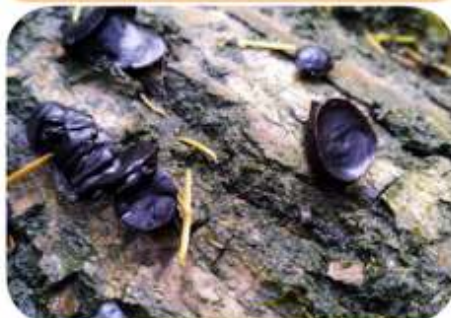
Zwarte knoopzwam, Heerde Bakhuisbos