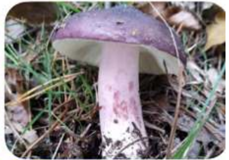
Duivelsbroodrussula, Heerde Ossenbergh