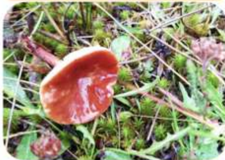
Levermelkzwam, Emst Vossenbroek