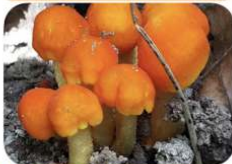
Oranjerode hertenzwam, Heerde Heerderstrand