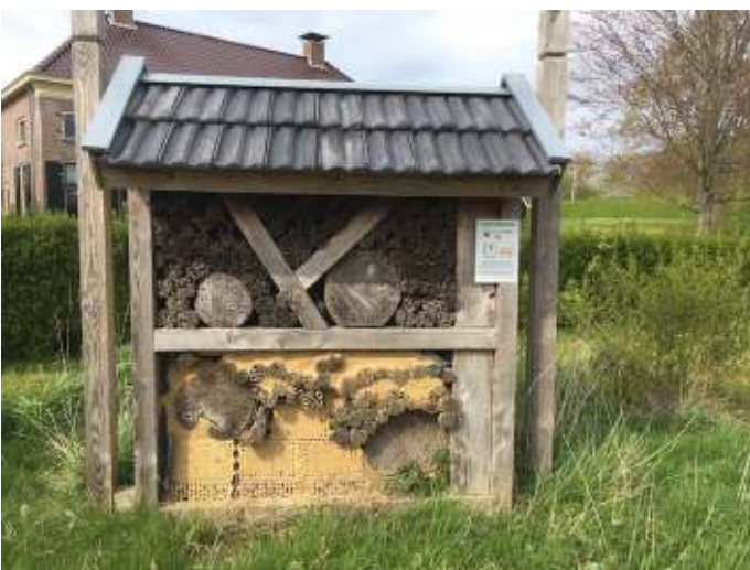
Insectenhotel - De Nijenstein Veessen

Voor het opvullen van de insectenhotels gebruiken wij bamboe maat 10-12 en oude rietmatten. Wanneer je bundels maakt met tie-ribs dan kun je dat prima zagen met een afkortzaag.