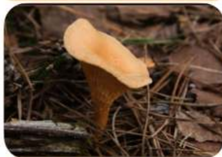
Valse hanenkam, Wapenveld Zwolsche Bos