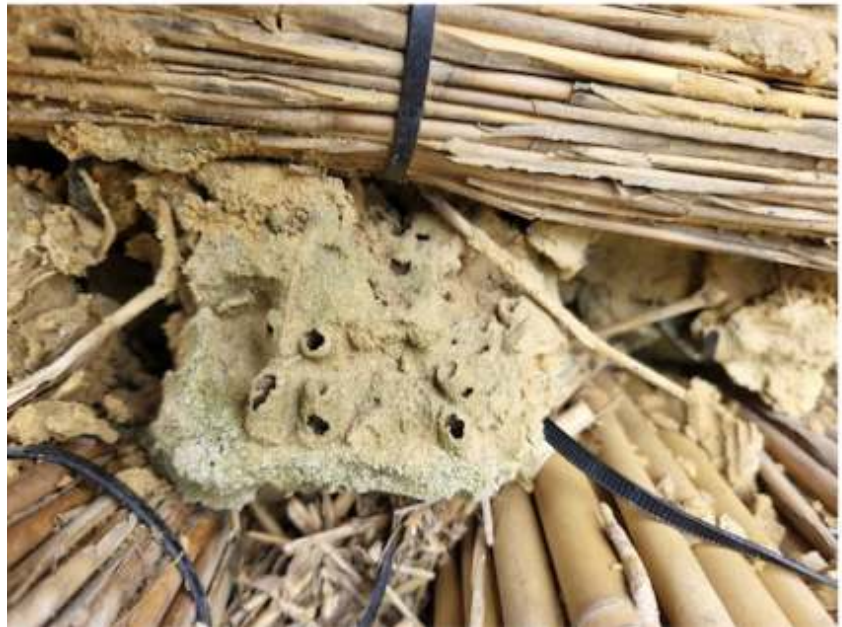
Broedcocons in leemspecie