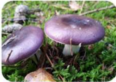
Papilrussula, Heerde Bakhuisbos