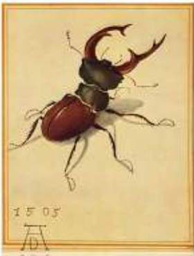
Vliegend Hert (1505): Albrecht Dürer.

Als kunsthistoricus ken ik Het Vliegend hert van Albrecht Dürer uit 1505: een waterverftekening van een mannetje. Andere namen voor deze kever zijn groot vliegend hert én hertkever.