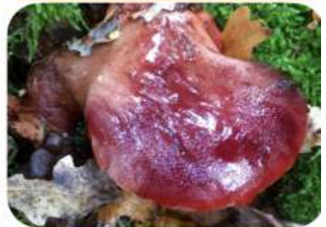
Biefstukzwam, Emst Apeldoorns Kanaal