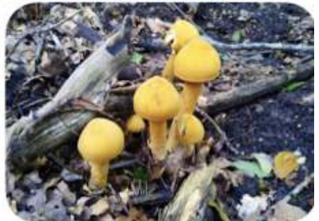
Goudhoed, Epe Norel e.o.