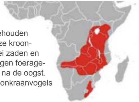
Leefgebied van Griuze kroonkranvogels in Zuid-Afrika

Herwin Looman bevestigde dat de kranvogels geringd waren en dus "gehouden vogels" zijn. Waar deze exemplaren vandaan komen weten we niet? Griuze kroonkranvogels hebben hun leefgebied in Zuidelijk Afrika en leven van allerlei zaden en ongewervelde dieren. Geen wonder dat wij de kranvogels regelmatig zagen foerageren op maisstoppels waar veelal maiskorrels en maiskolven achterblijven na de oogst. Regelmatig worden gehouden kooivogels waargenomen, maar Griuze kroonkranvogels zijn zover ik weet niet eerder in ons werkgebied waargenomen.