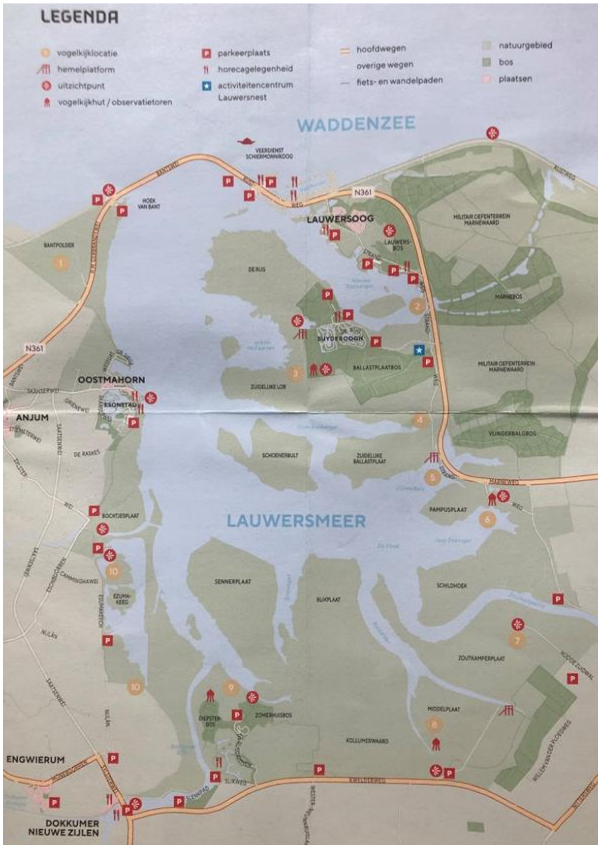
Bijlage 1: Overzichtskaart Nationaal Park Lauwersmeer