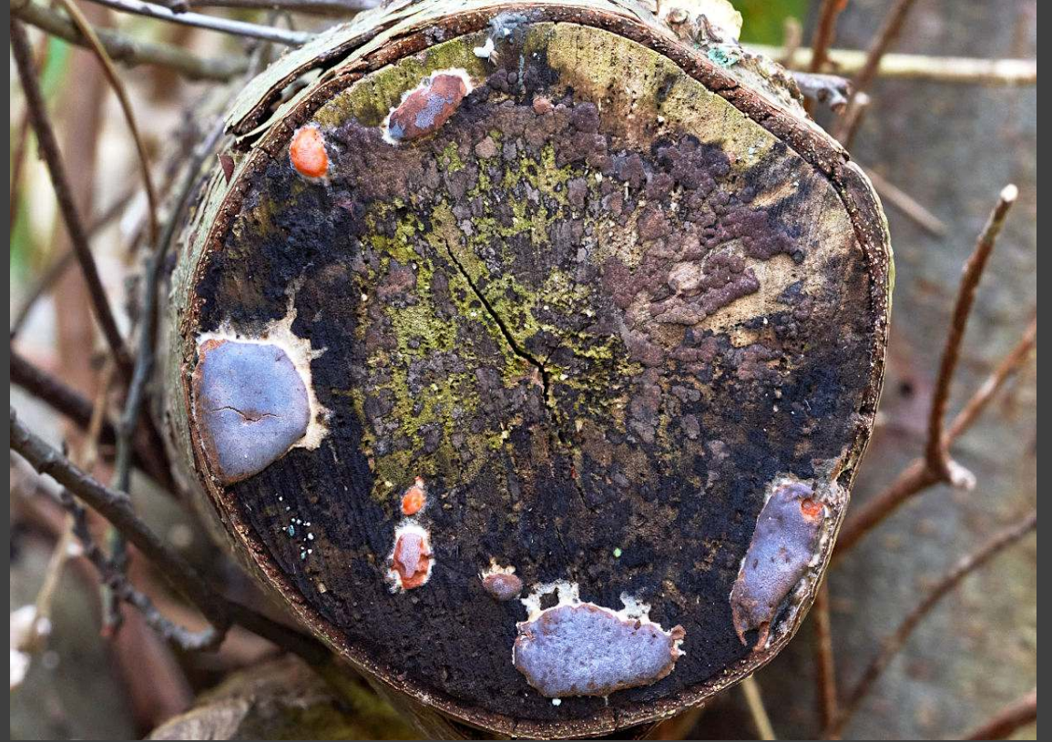
Loodkleurig netplaatje - Dictydiaethalium plumbeum een verkleurende slijmzwam, gaat van roze naar loodkleurig