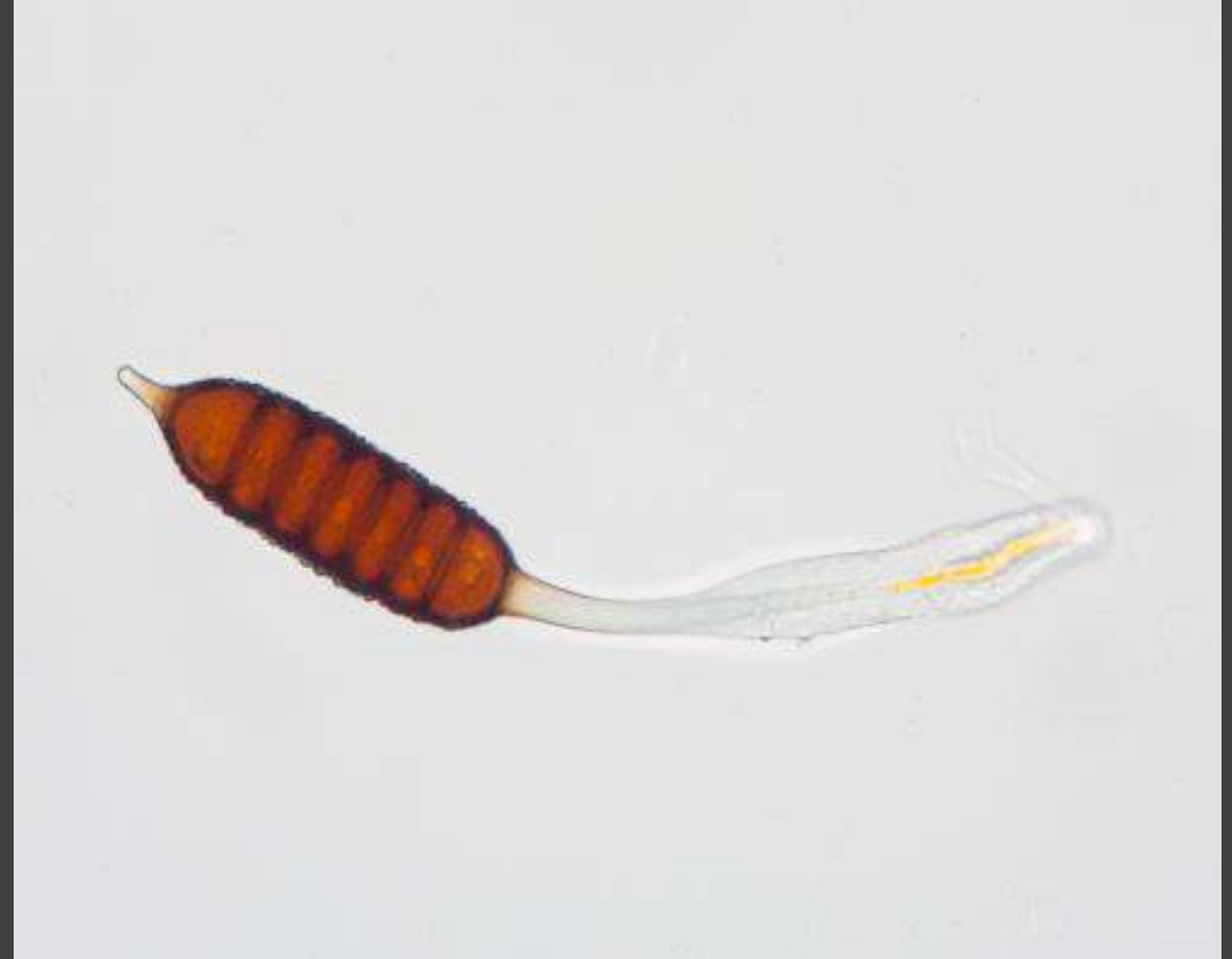
Gladde roosroest - Phragmidium rosae prachtige schimmel, met vijf soorten sporen, hier een teliospoor