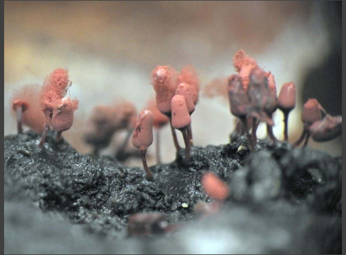
Karmijnrood netwatje – Arcyria denudate leeft op dood loofhout