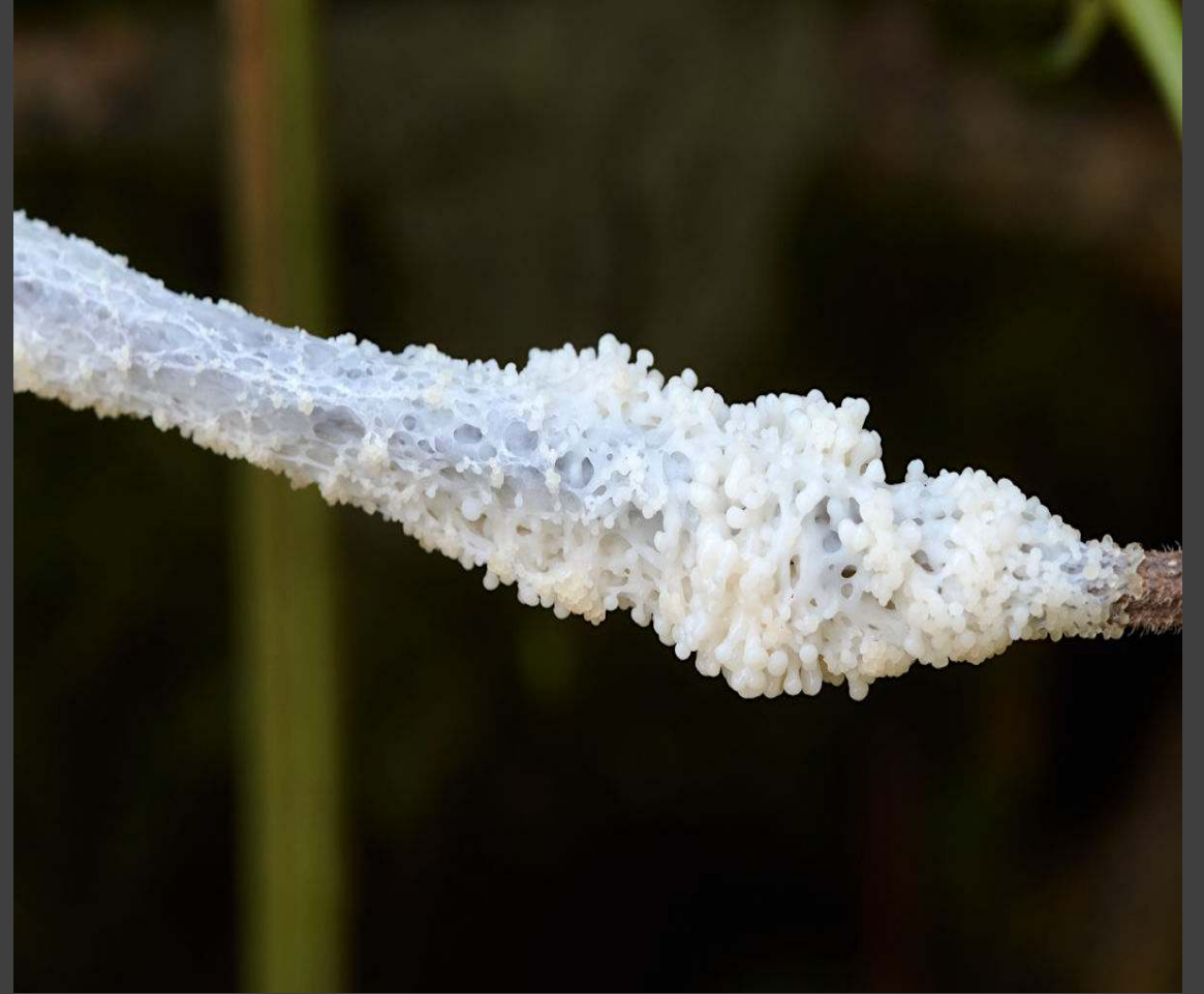
Groot kalkschuim - Mucilago crustacea nog een slijmzwam op kruidachtige plantendelen