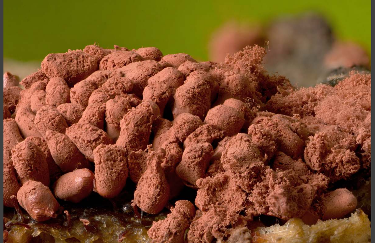
Worstnetwatje – Arcyria stipata leeft op vochtig hout van naaldbomen