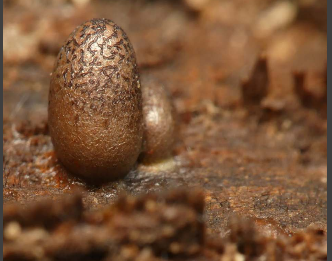
Dwergboomwrat - Lycogala conicum slijmzwam met een conische vorm op dood hout