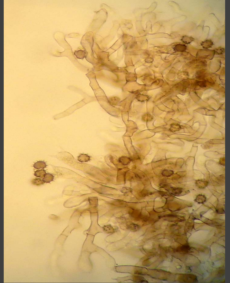
Bruin rouwkorstje - Tomentella badia op verterend hout van loof- en naaldbomen met stekelige sporen