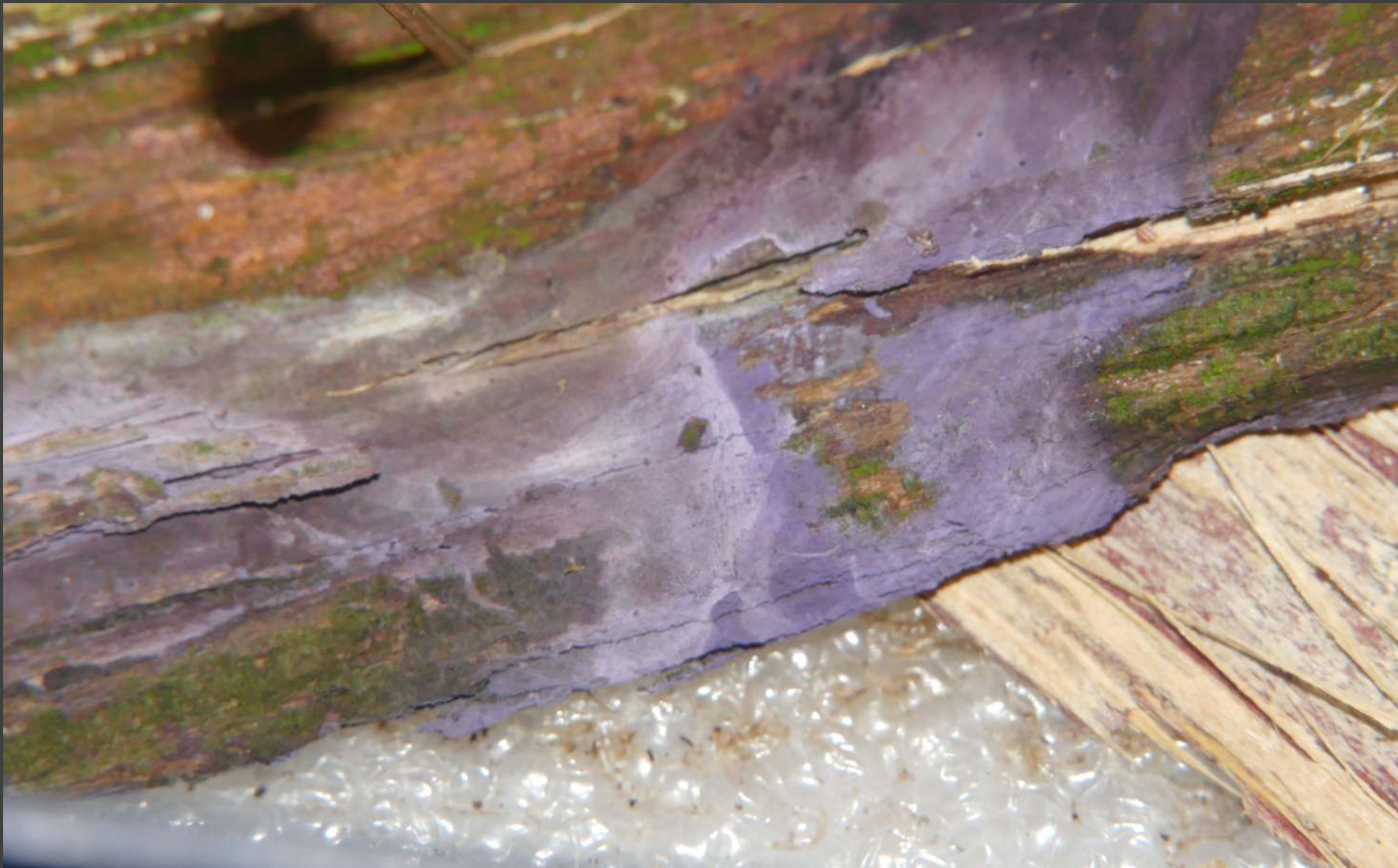
Glad blauwspoorkestje - Amaurodojn mustialaensis één stip in de Verspreidingsatlas, in Noord-Groningen en nu ook hier