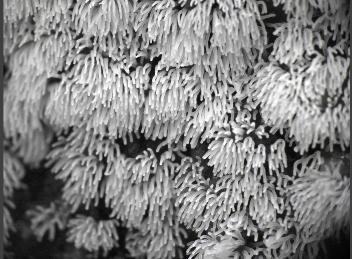
Gewoon ijsvingertje - Ceratiomyxa fruticulosa ook een slijmzwam, nu met 1 spoor op een steeltje