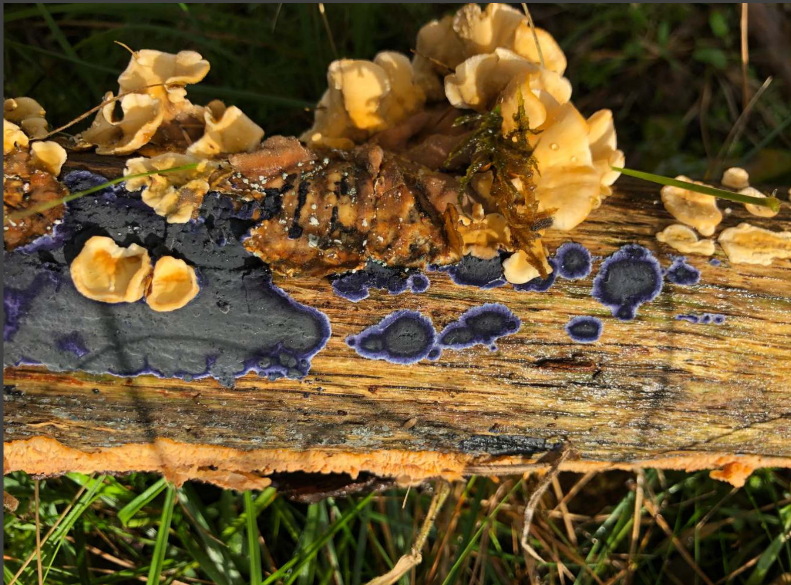
Blauwe (KW) en Gele korstzwam gebroederlijk bij en zelfs op elkaar