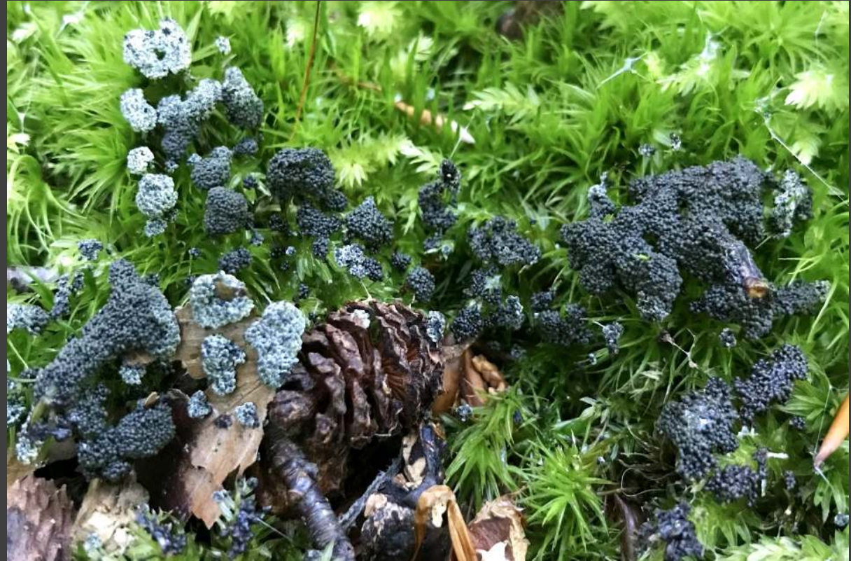
Grijsgroen kalkkopje - Physarum virescens leeft sapotroof op plantendelen en verkleuring zit al in de naam