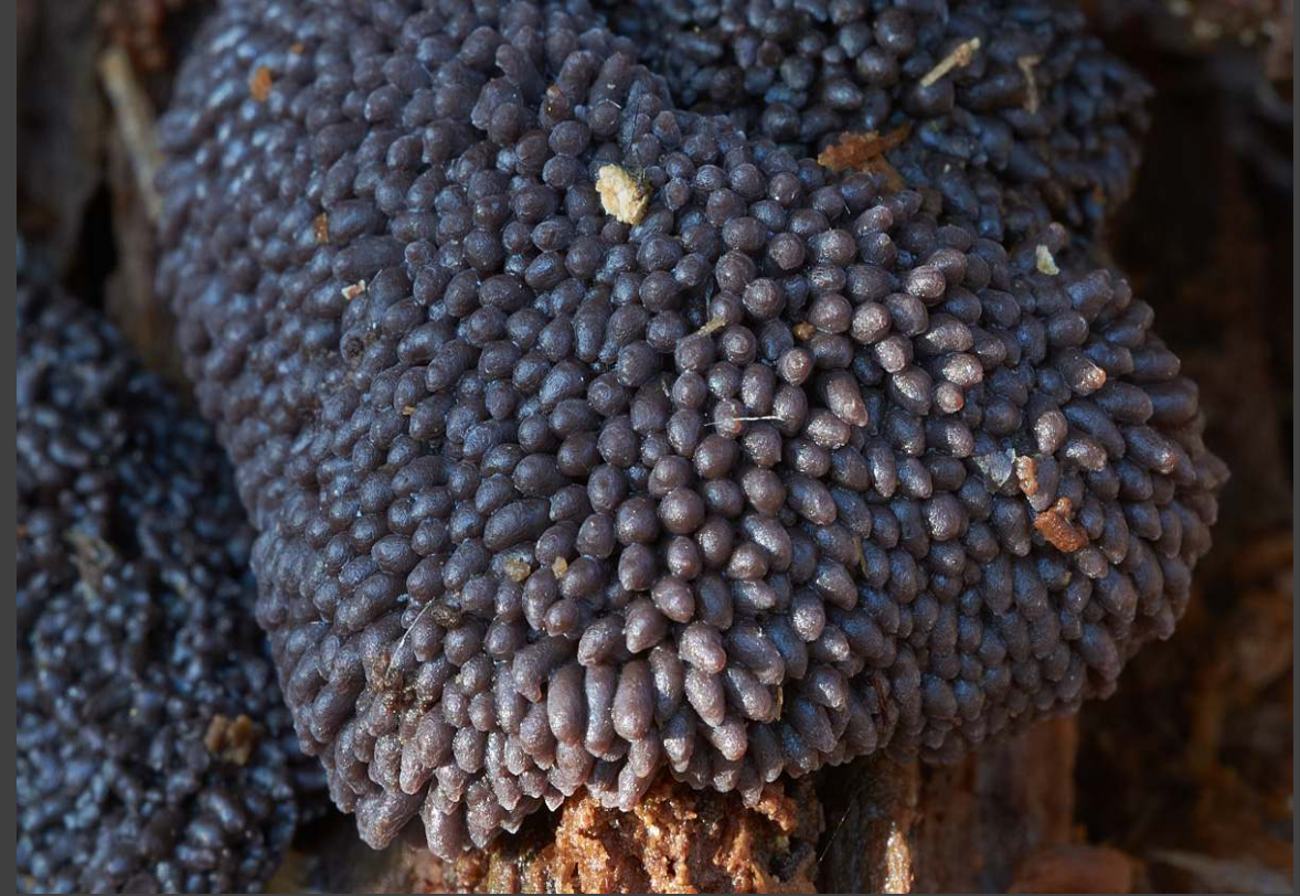
Rosig buiskussen - Tubifera arachnoidea deze slijmzwam op dood hout verkleurt ook prachtig